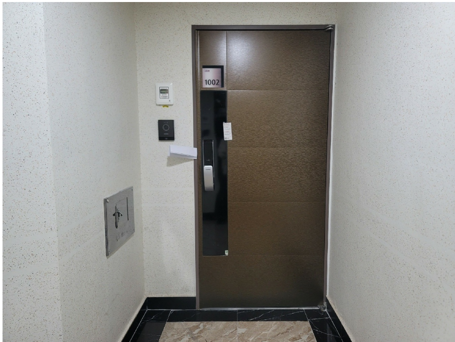
( ) - 10 1002