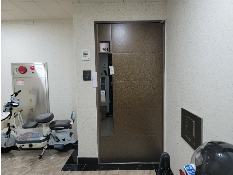
( ) - 7 704