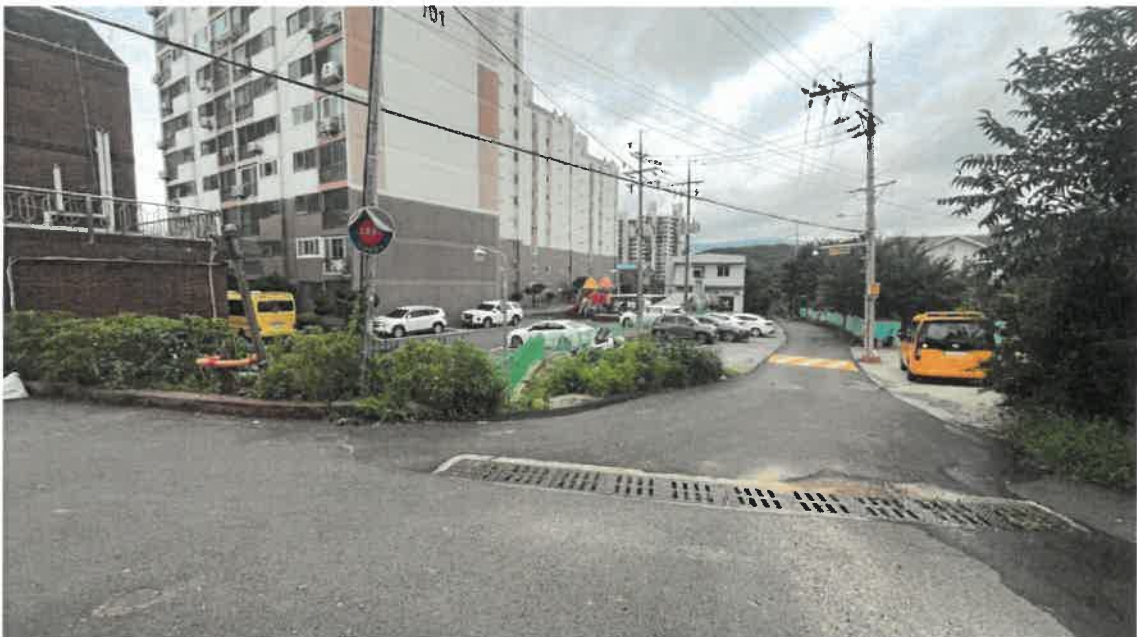
본건 근경 및 주위환경