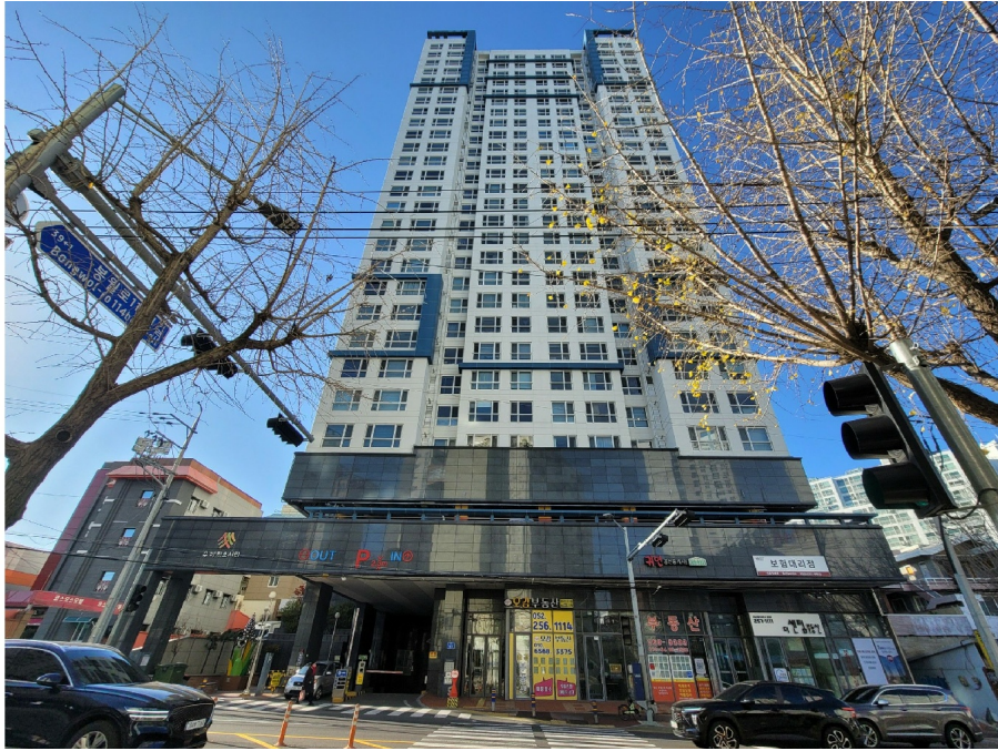
( 4 409 )