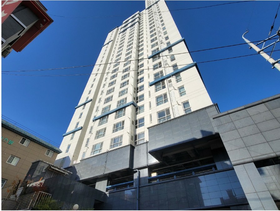
( 4 409 )