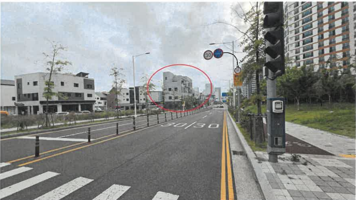
본건 및 주변전경