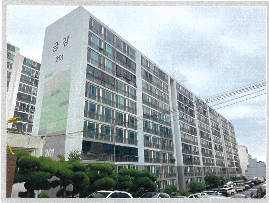
【 본건전경 - 서측에서 촬영 】