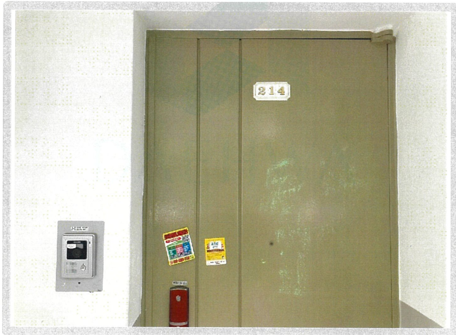
【 본건현관 】