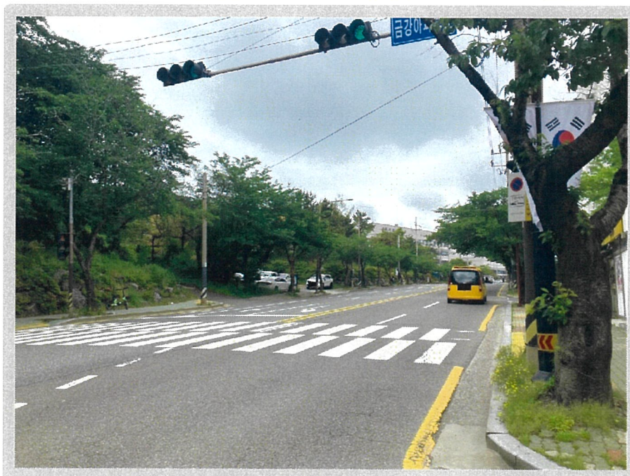
【 주위환경 - 서측에서 촬영 】