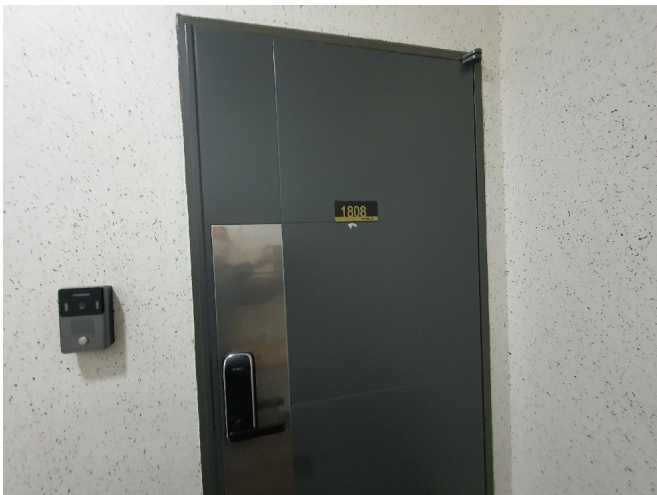
( 1808 )