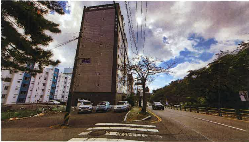
본건 및 주위환경