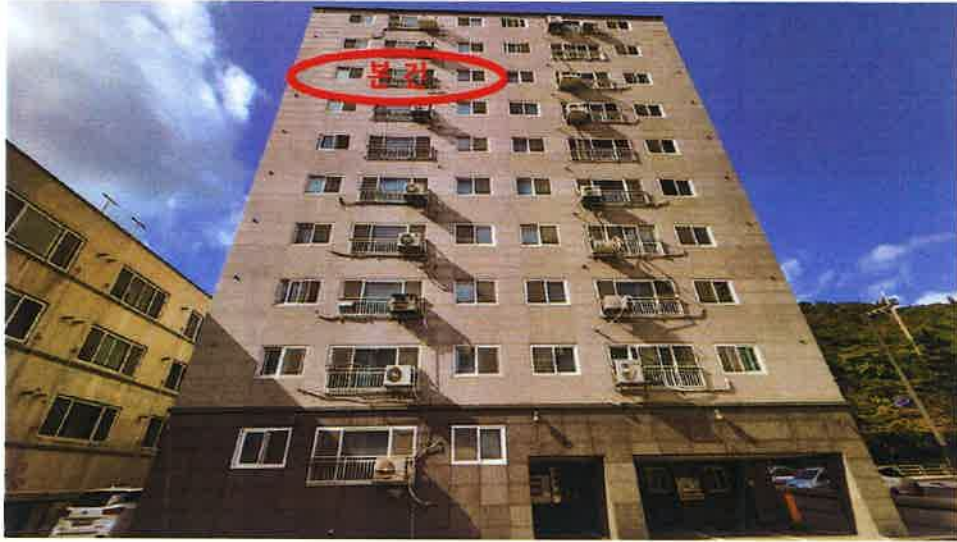
본건(화정동명성블루빌3차 제802호) 전경