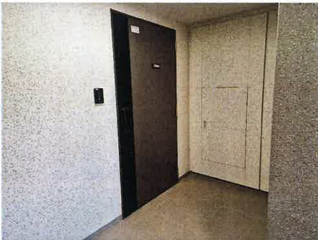
[본건 현관문 및 복도 전경]