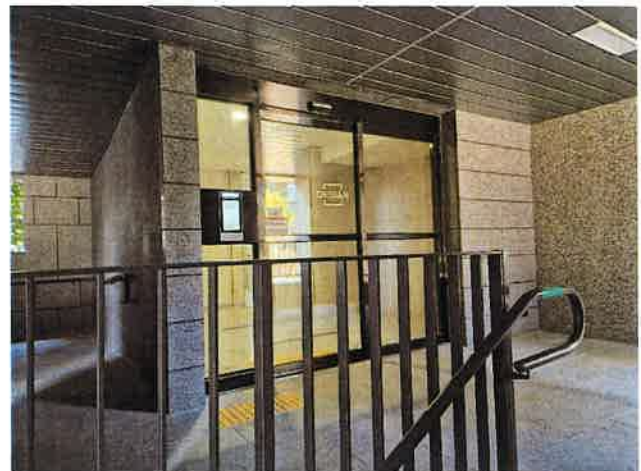
[공동 출입구 전경]