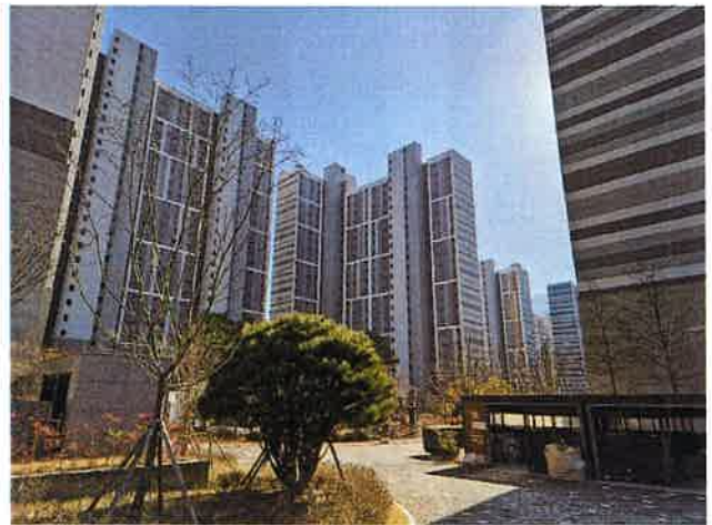
[아파트 단지의 전반적 전경]