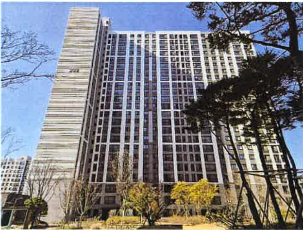
[본건 남동측 전경]