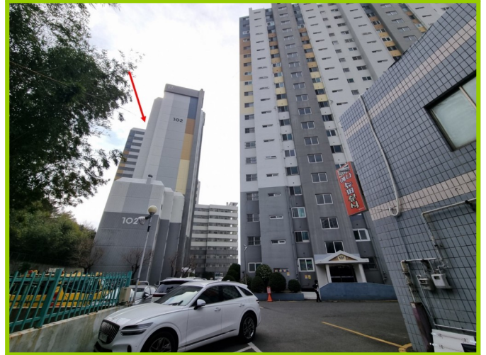
102동 (북측에서 촬영)