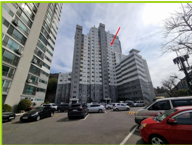
102동 (북서측에서 촬영)