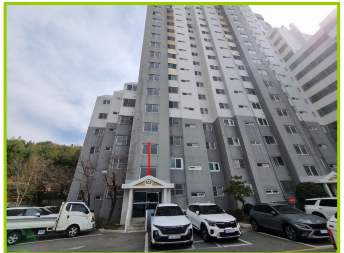
102동 1, 2호 라인 입구