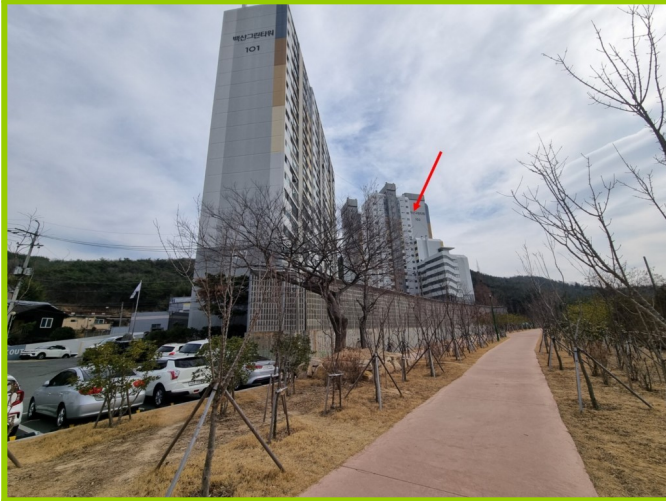
단지전경 (서측에서 촬영)