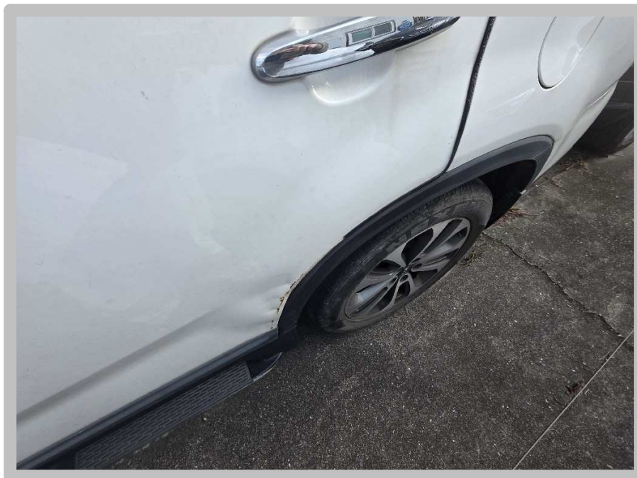
【 본건 전경 】