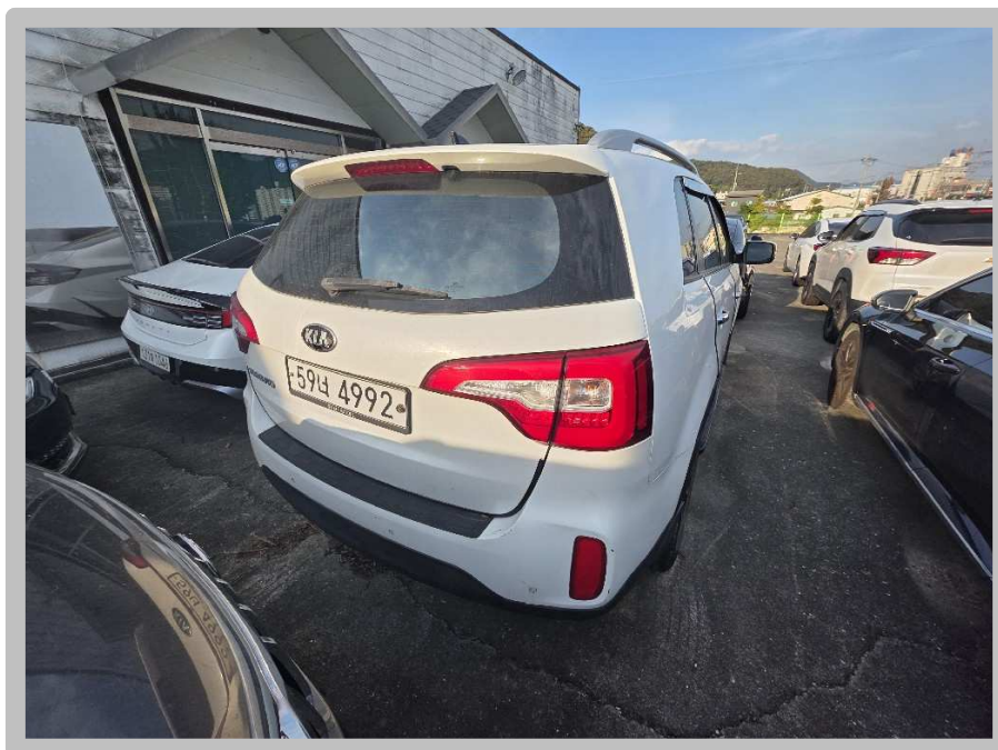
【 본건 전경 】