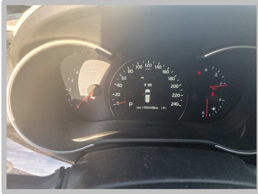
【 본건 전경 】