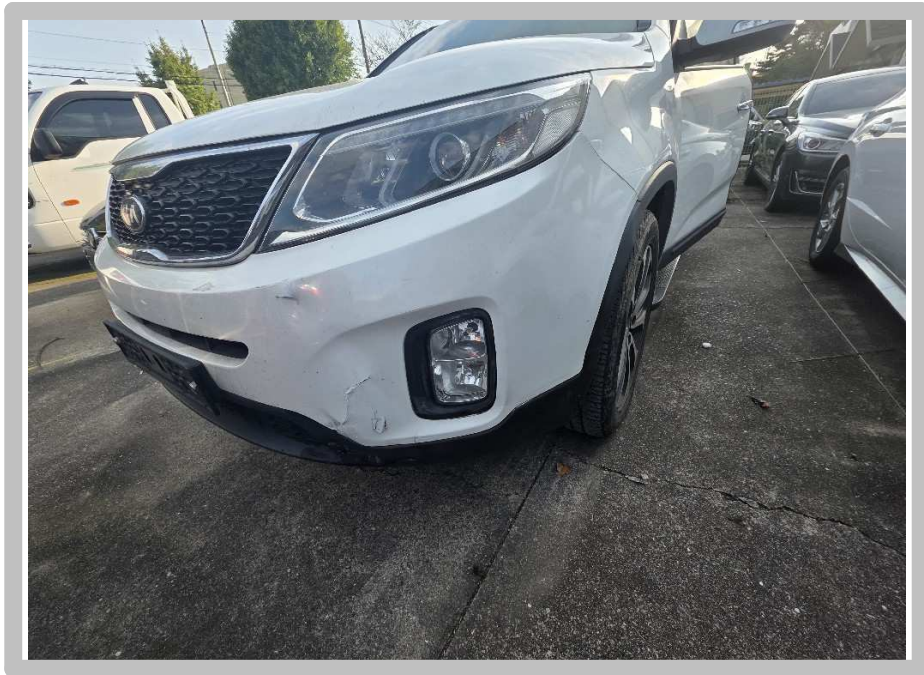
【 본건 전경 】