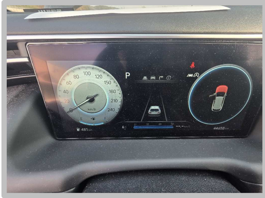
【 본건 전경 】