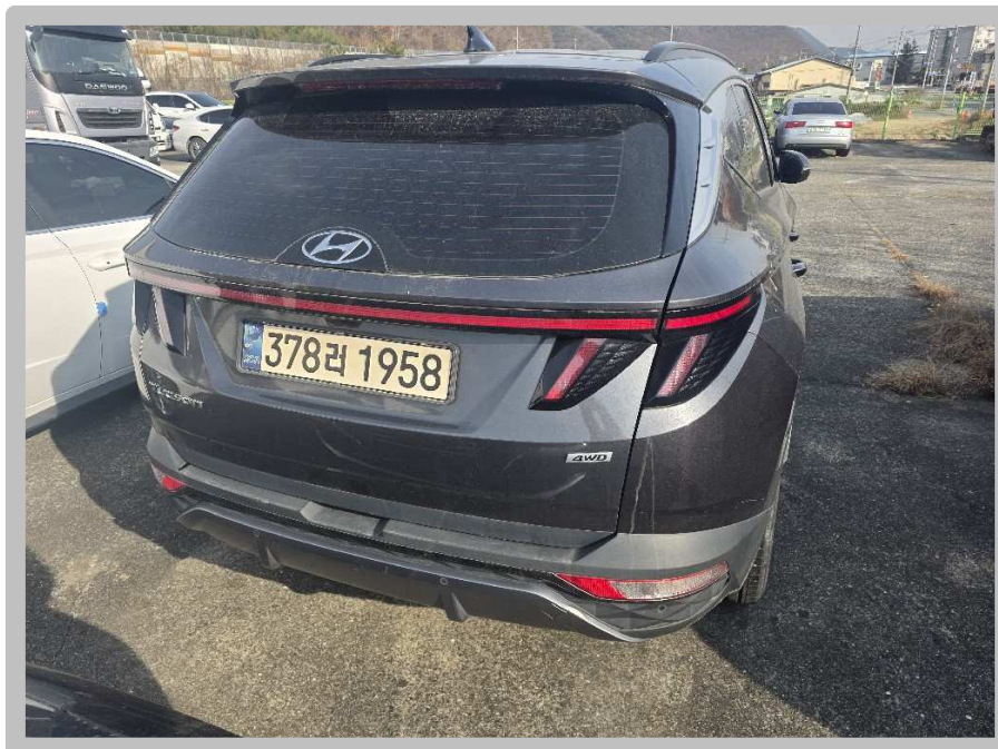
【 본건 전경 】