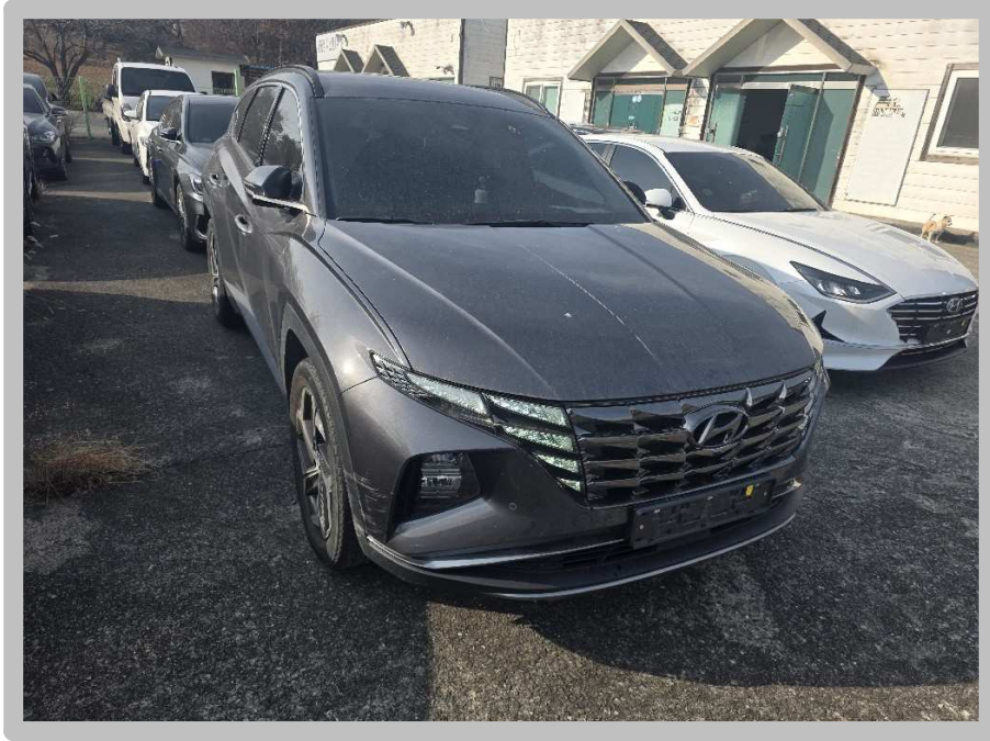
【 본건 전경 】