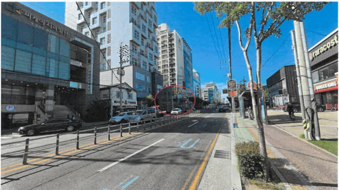
본건 및 주변전경