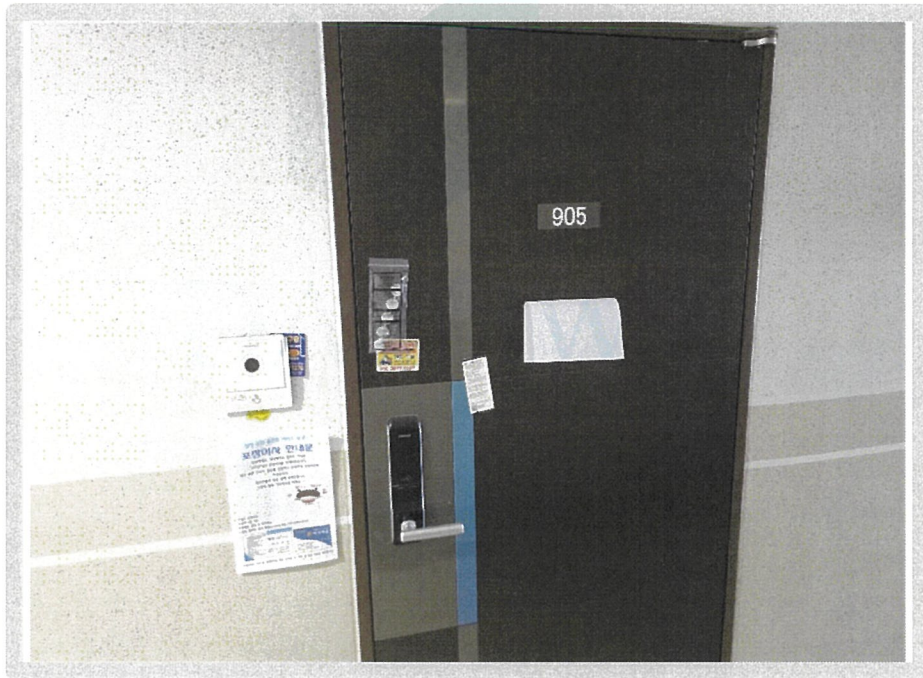
【 본건 현관문 전경 】