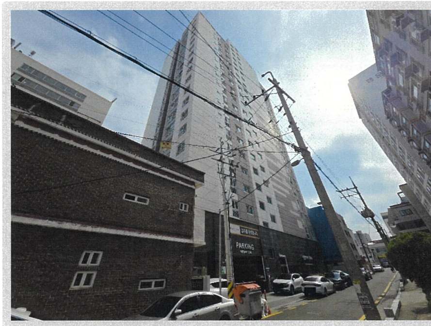
【 주위 환경 - 북동측에서 촬영 】