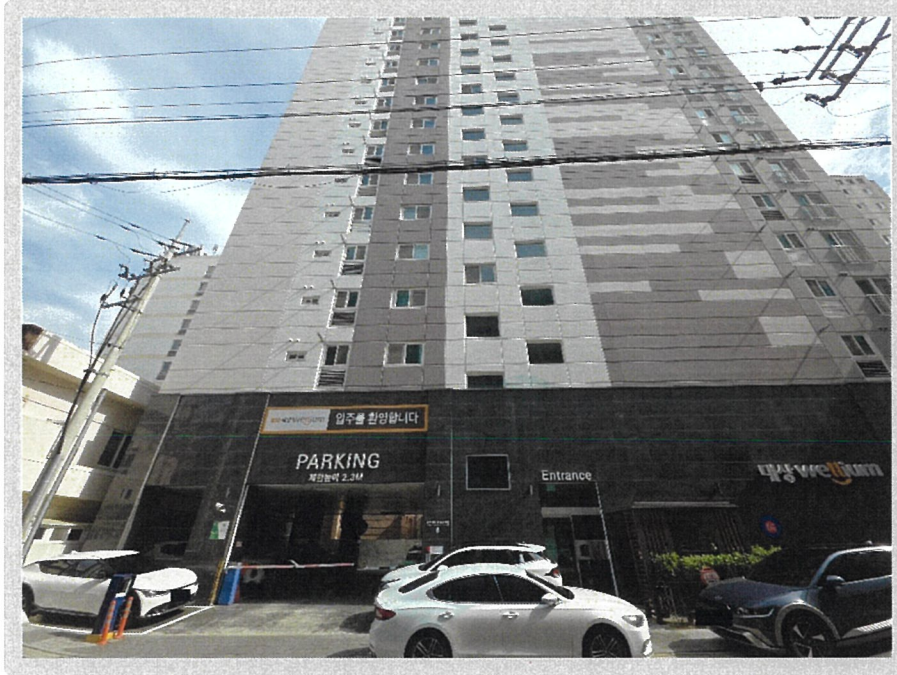
【 본건 소재 건물 전경 】