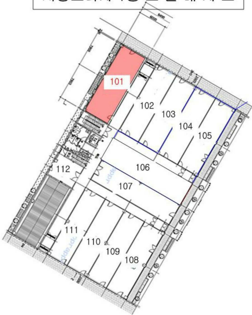
서영프라자 1층 호별 배치도

소재지 경상남도 양산시 물금읍 가촌리 1269-9 서영프라자 1층 101호