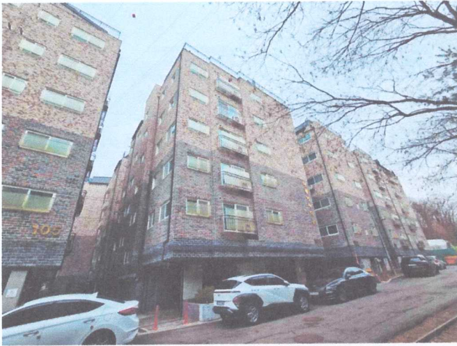
본건 소재 건물 전경