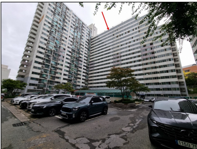
102동 (북서측에서 촬영)