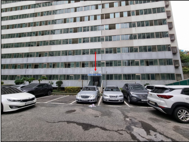
102동 (1~7호 라인 북서측 입구)