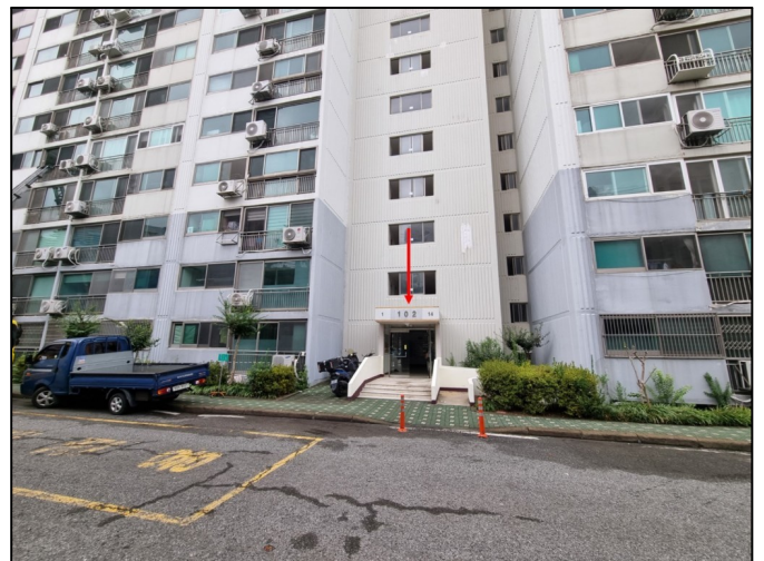
102동 (남동측 입구)