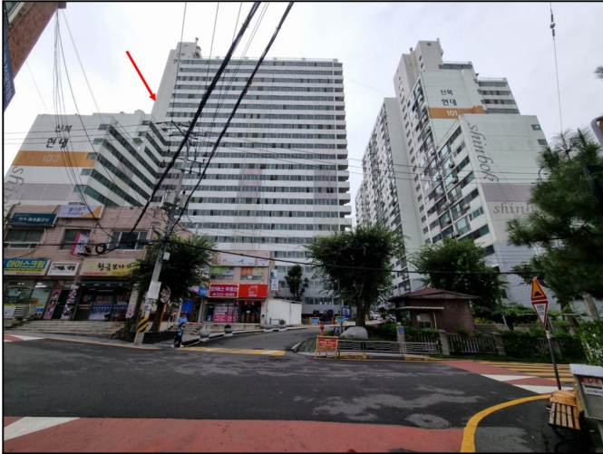
단지전경 (북동측에서 촬영)