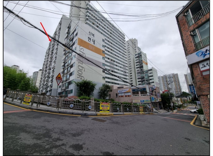
단지 전경 (남동측에서 촬영)