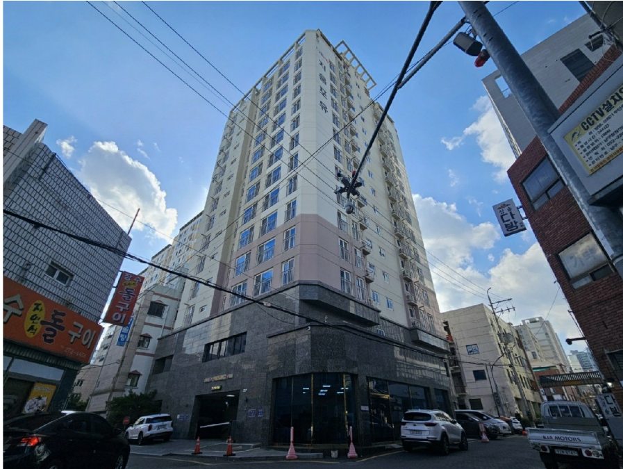
( 5 502 )