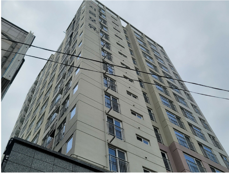
( 5 502 )