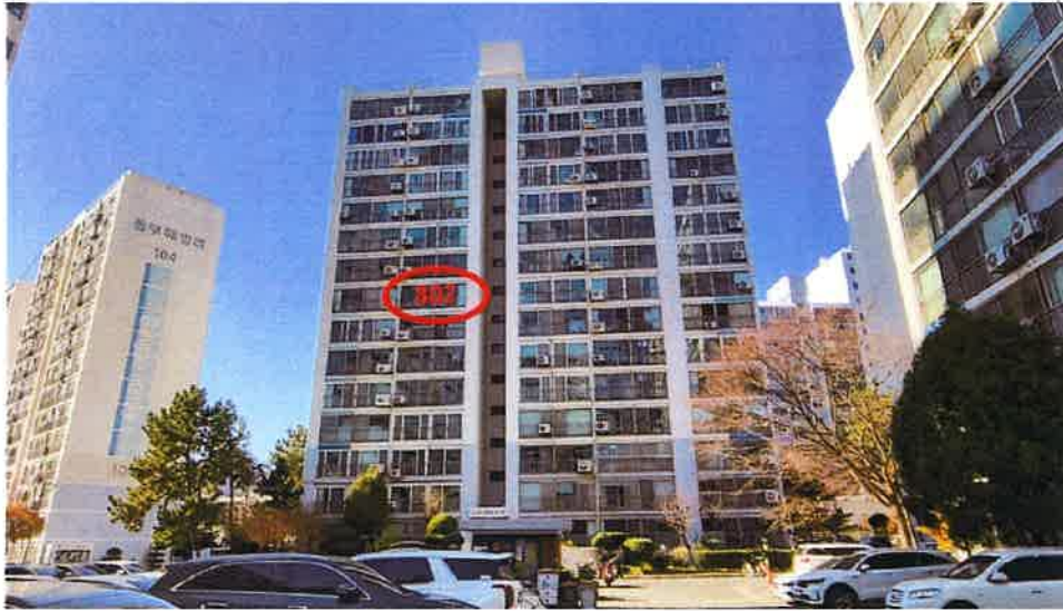
본건(111동 802호) 전경