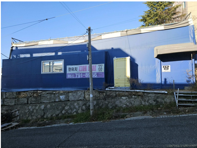
제시외 물건 ㉠, ㉡