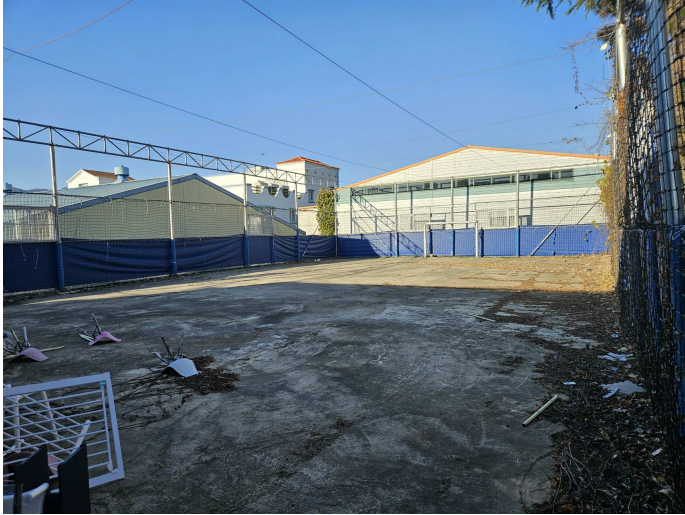
본건 및 펜스