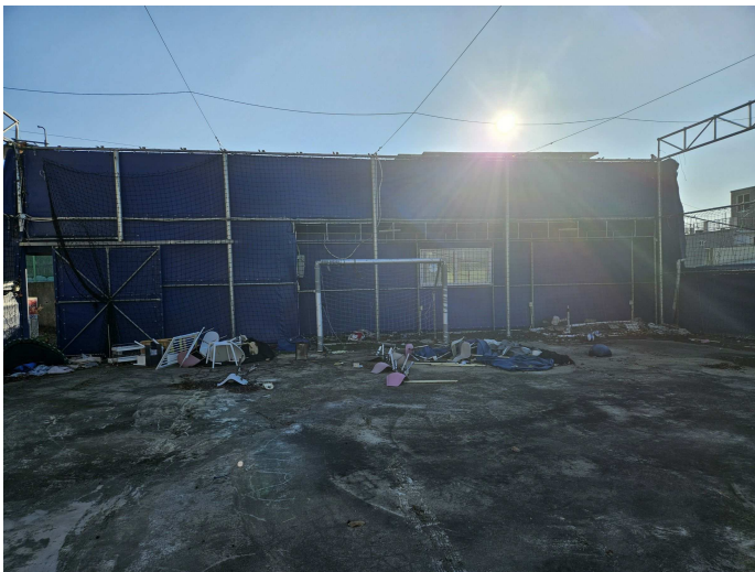
본건 및 펜스, 골대