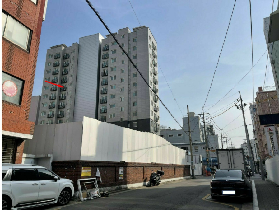
미림에이클래스 전경 및 본건