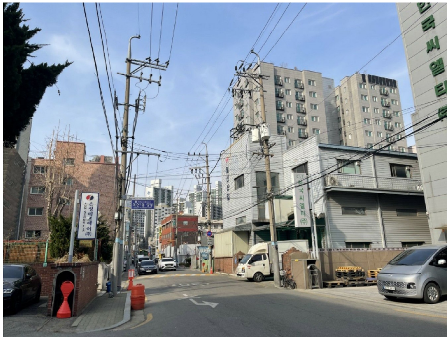
본건 남서측 주변환경