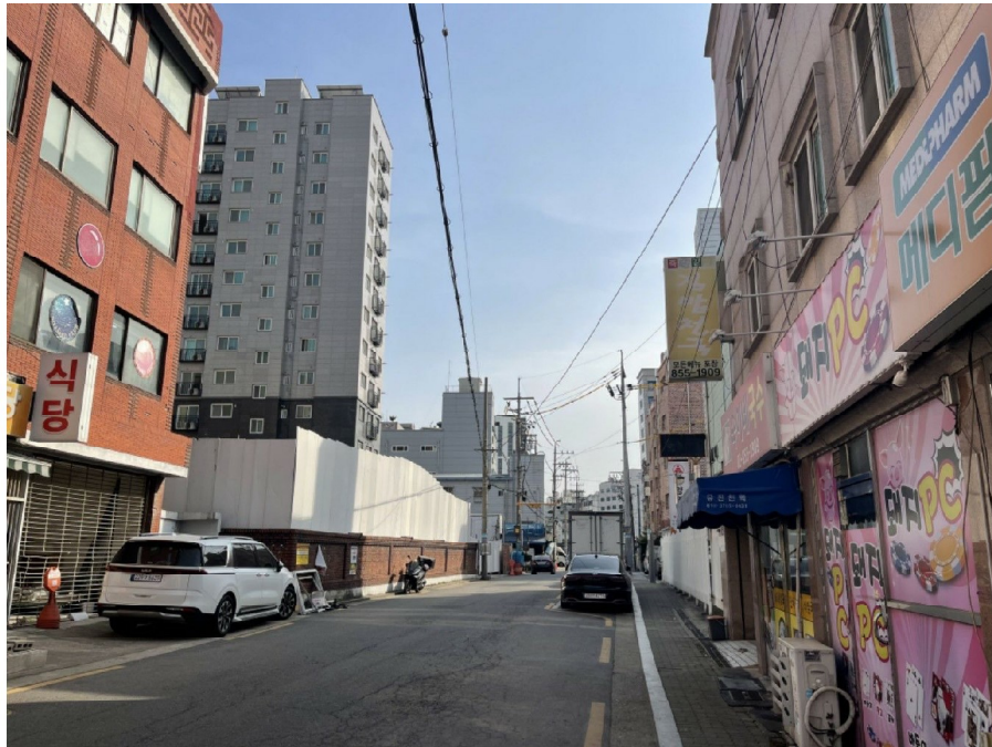
본건 북서측 주변환경