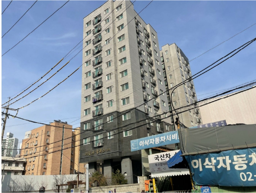
본건소재 건물 남서측 전경