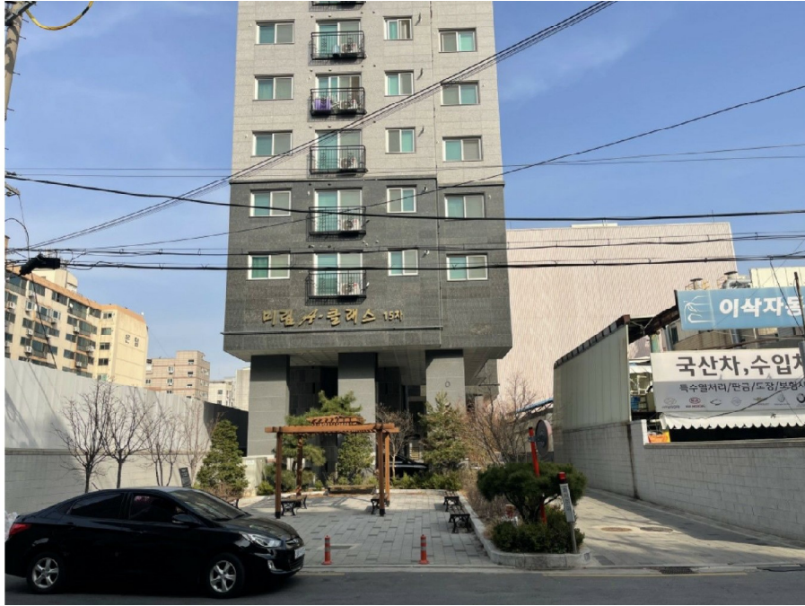
미림에이클래스 서측 전경 및 출입로