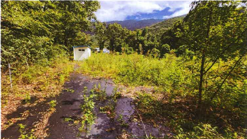
본건 전경(남서측에서 촬영)