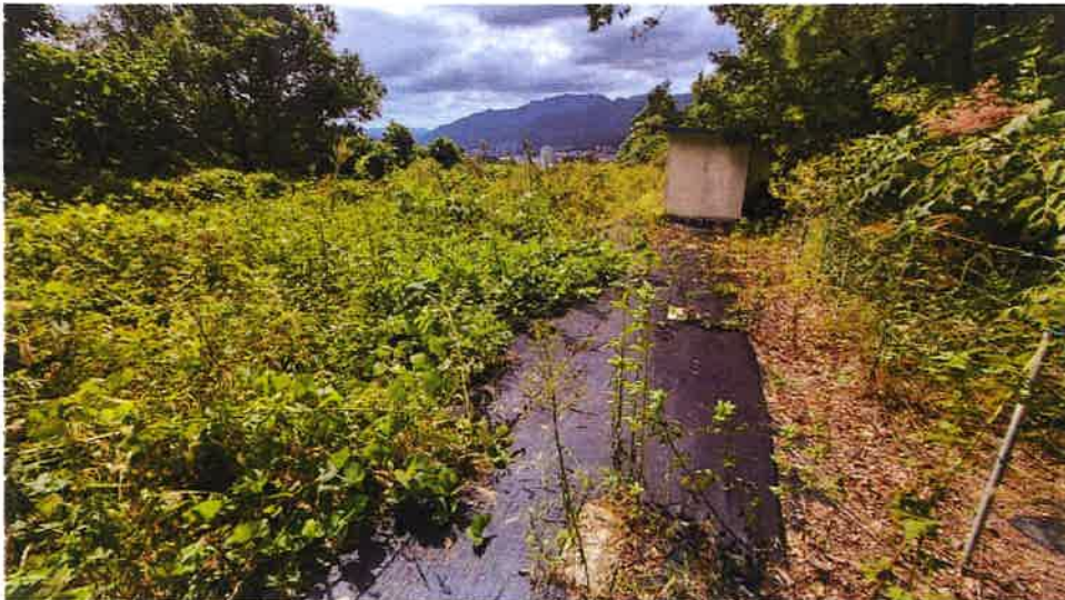
본건 전경(북동측에서 촬영)