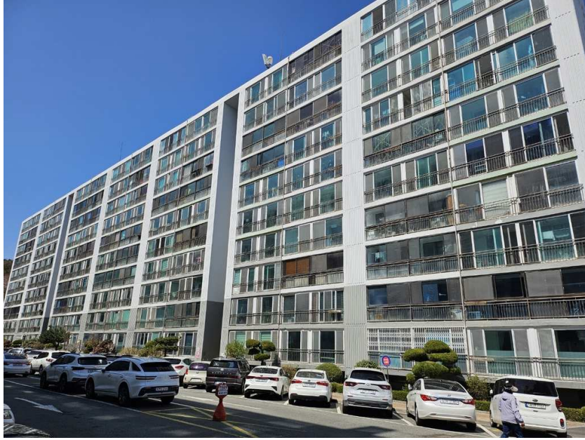
[ 대상물건 전경 ]