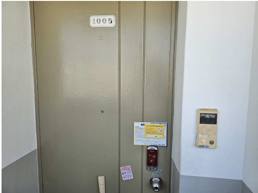
[ 대상물건 현관전경 ]