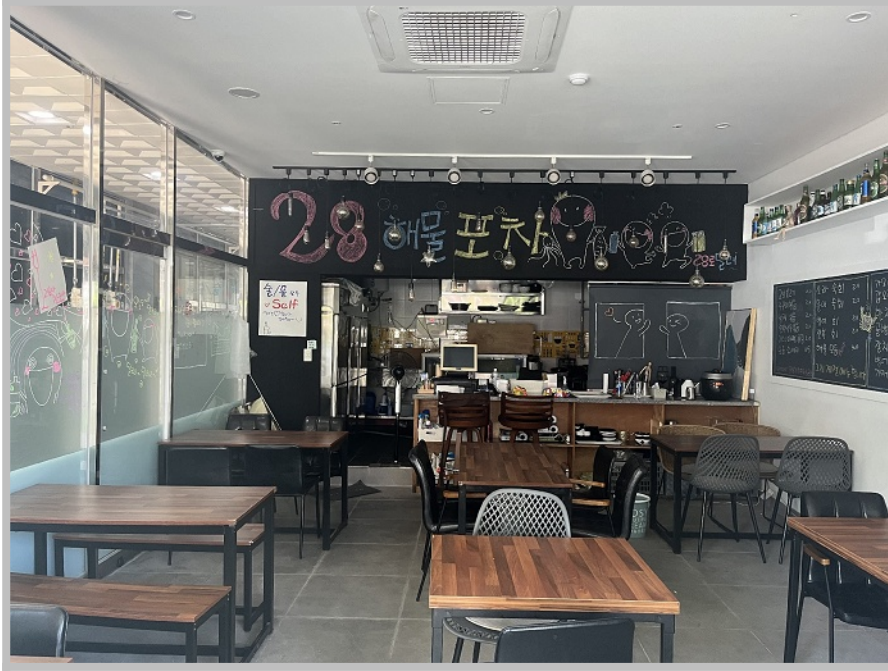
【 본건 내부 】