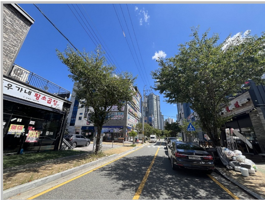
【 주위 환경 】