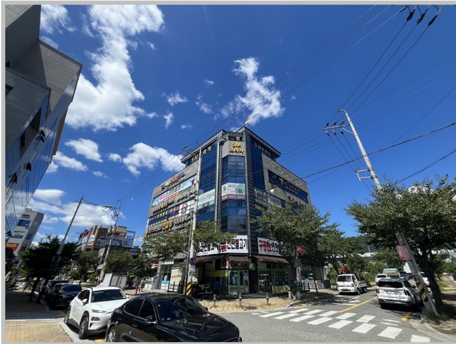
【 본건 전경 】