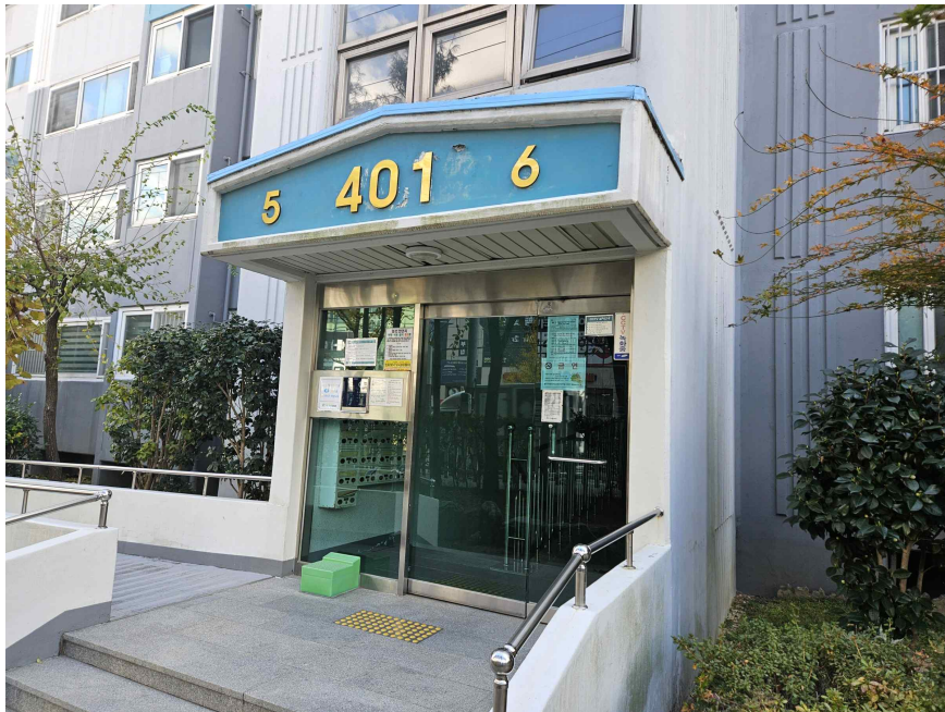
본건 출입구 전경