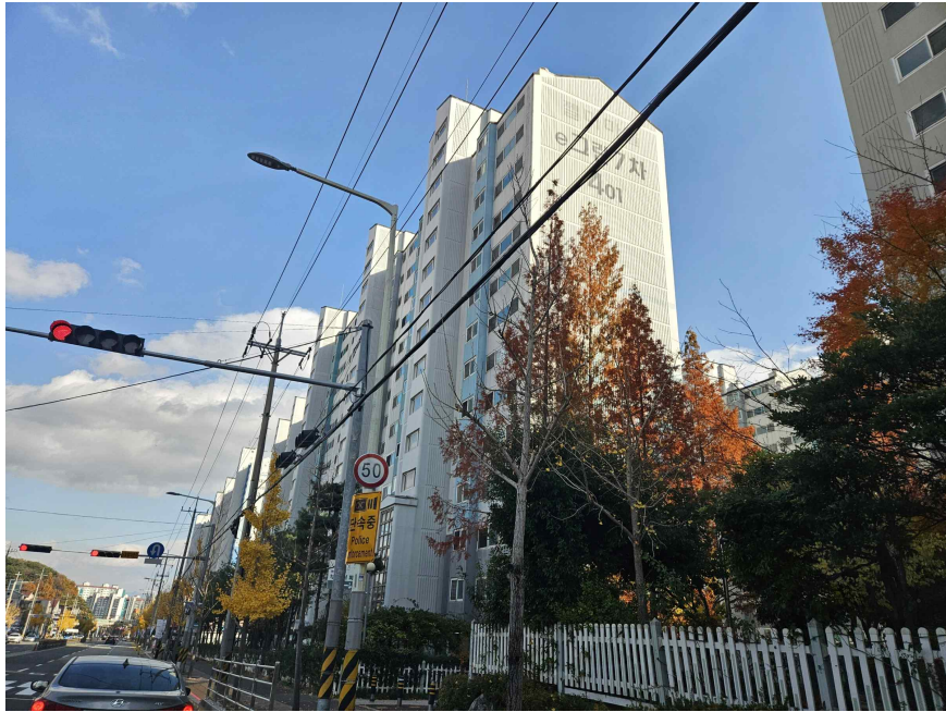
본건 외부 전경