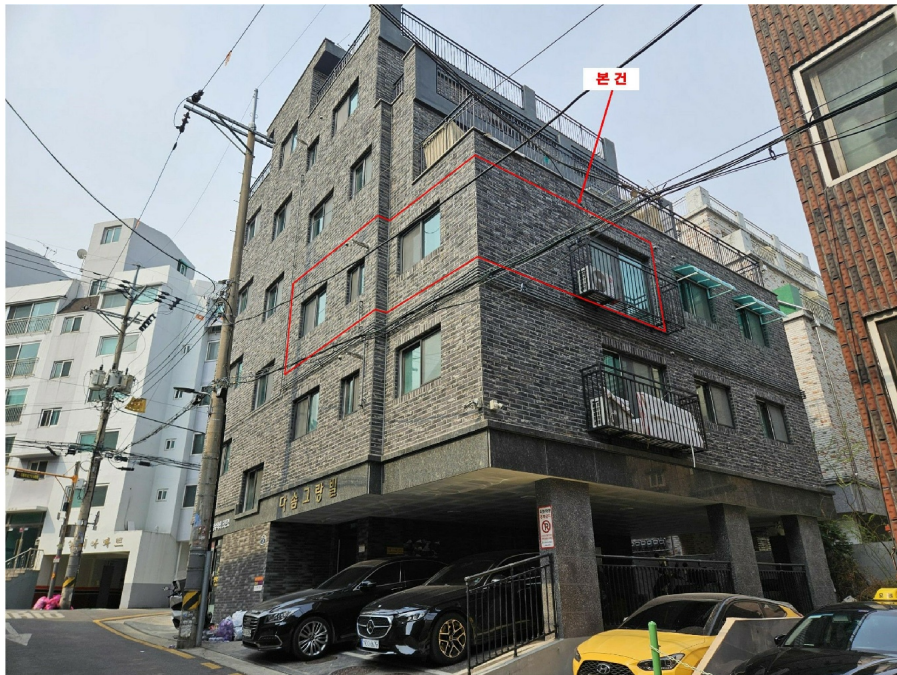
< 2 >