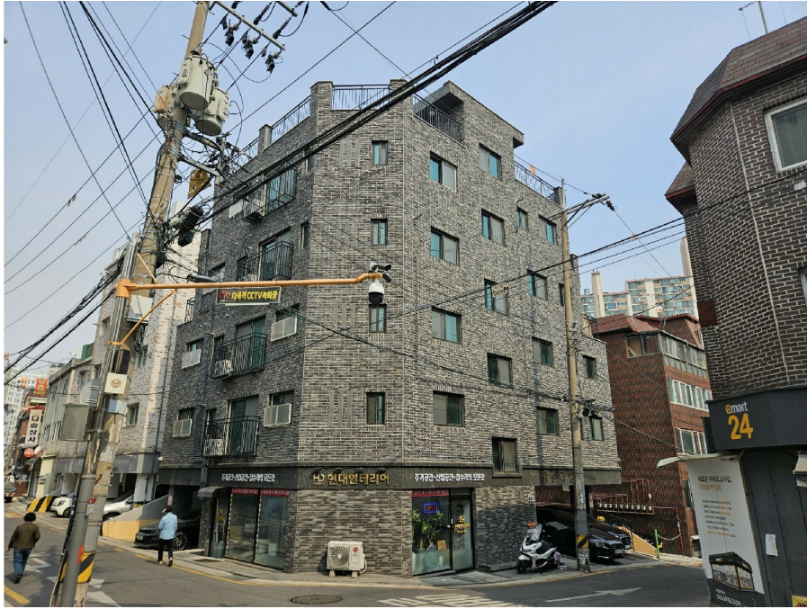
< 1 >