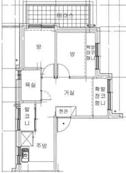
[ 내부구조도 ]

(임대관계는 미상이며, 내부구조는 이해관계인의 부재로 확인하지 못하여 외부관찰 및 인근 탐문조사, 집합건축물대장상 건축물현황도 등에 의거 도시하였는바, 귀 원 경매 진행시 참고바람.)