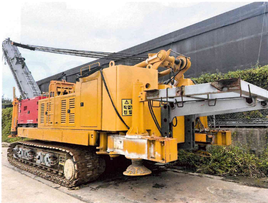
본 건 전경