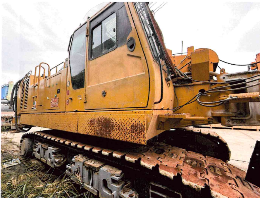
본 건 전경