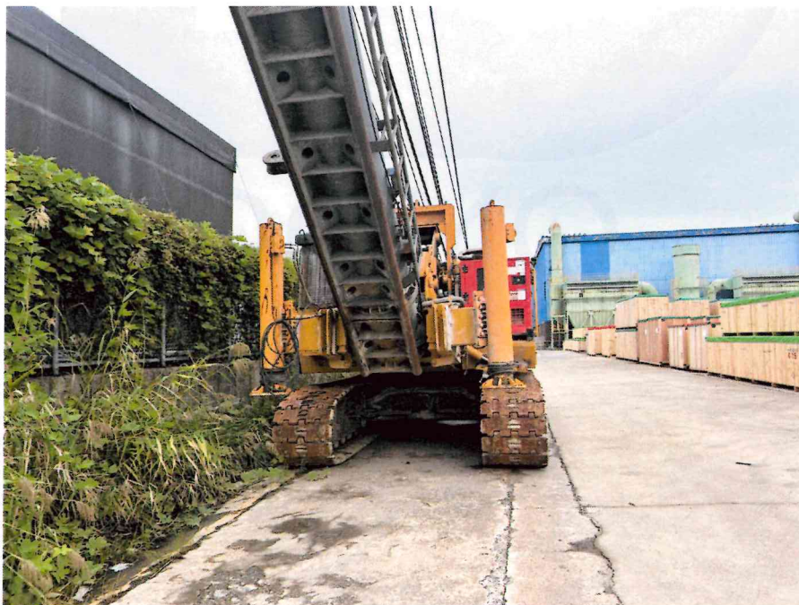
본 건 전경