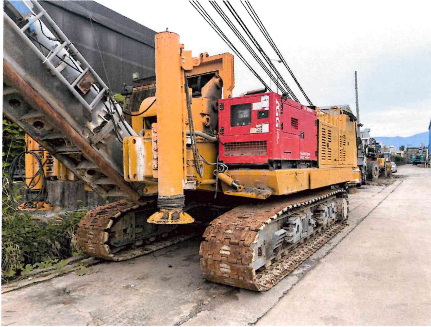
본 건 전경