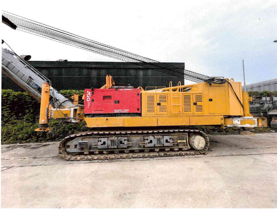
본 건 전경