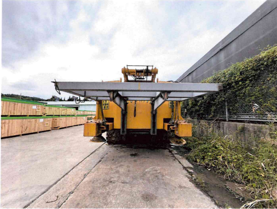
본 건 전경