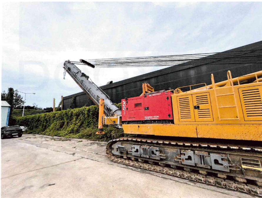
본 건 전경