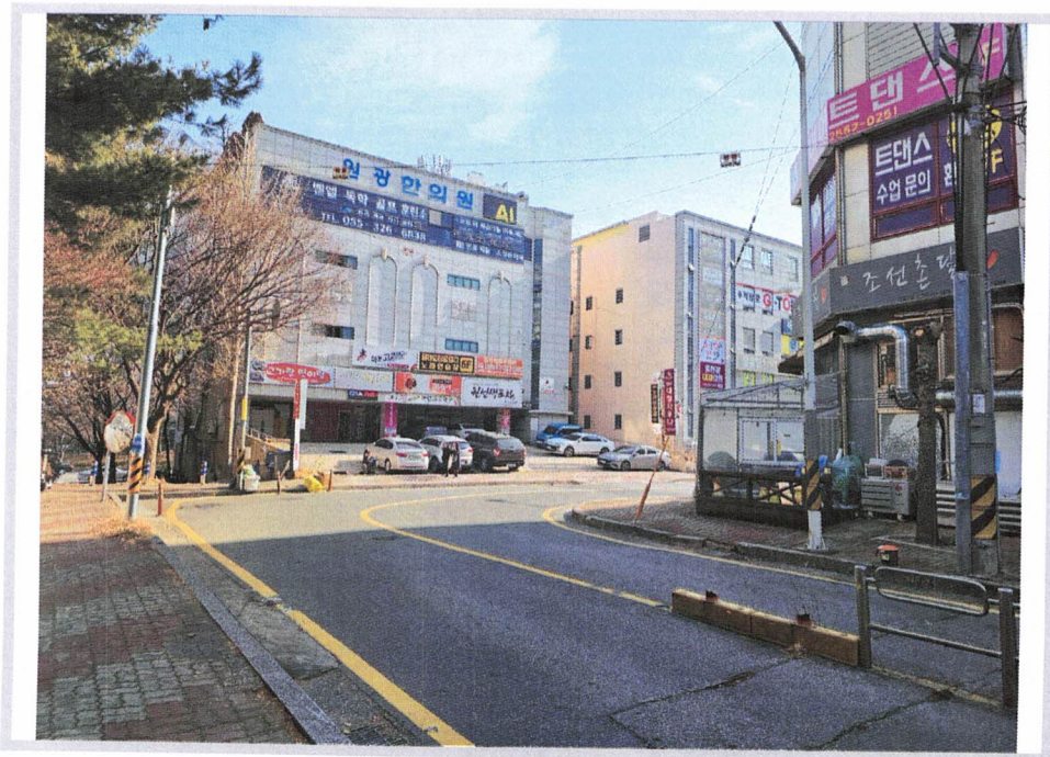
< 본건 빌딩 및 주위환경(후면 종로변) >