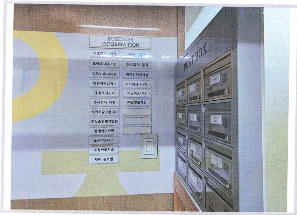
< 본건 내부 입구 >