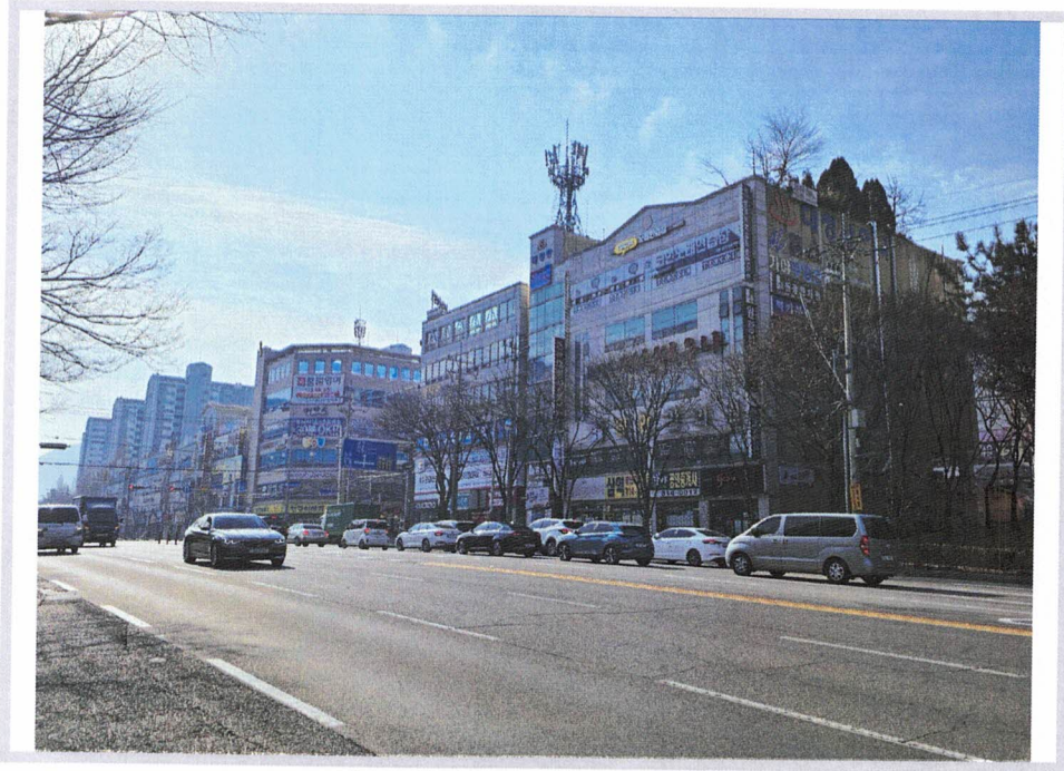
< 본건 빌딩 및 주위환경(전면 광대로변) >