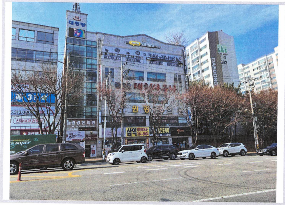
< 본 영해빌딩 전경 >