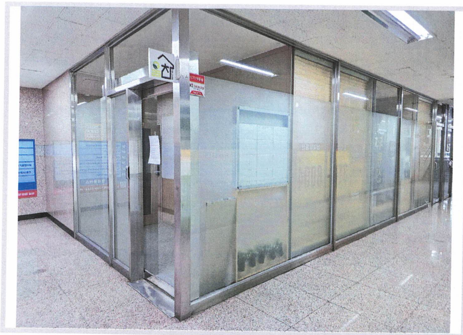
< 본건 전경 >