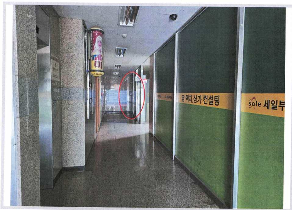
< 1층 내부 복도 및 본건 >