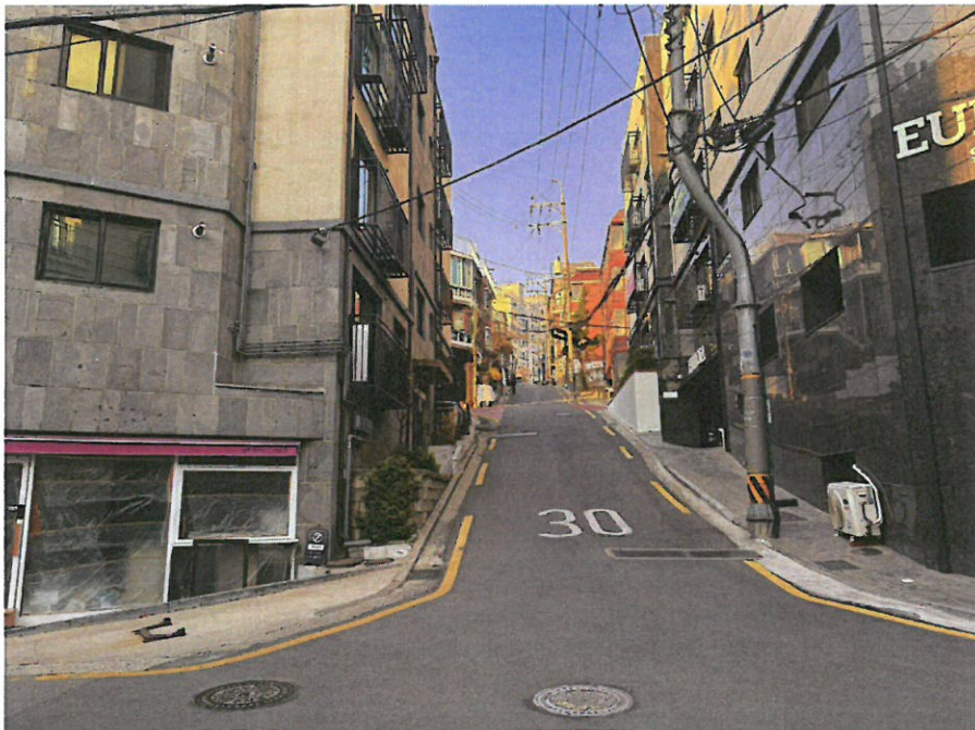
본건 및 주위환경