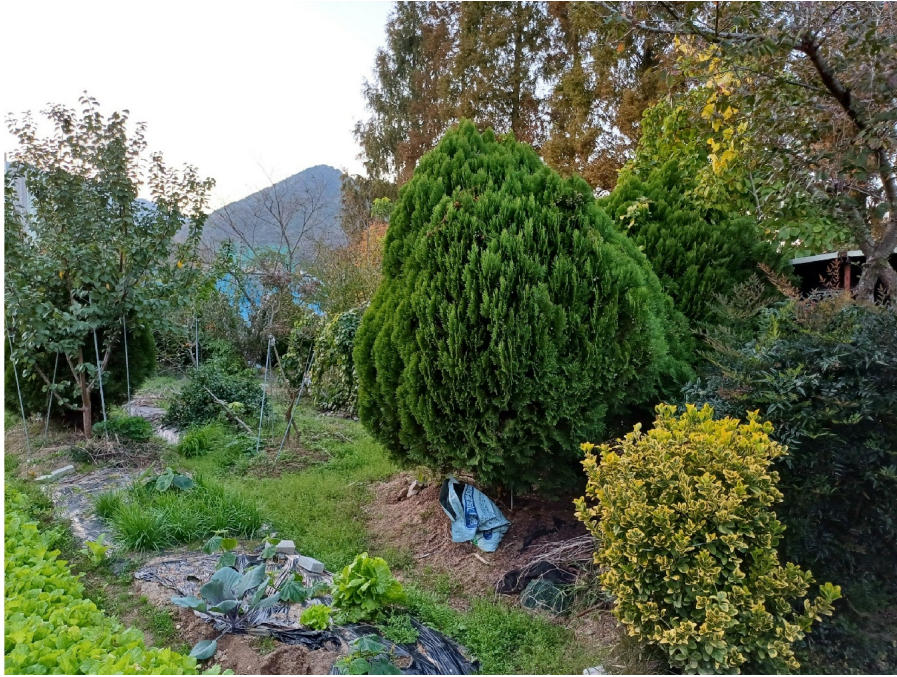
1 ( )