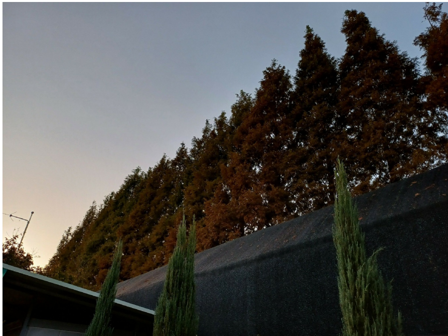
1 ( )