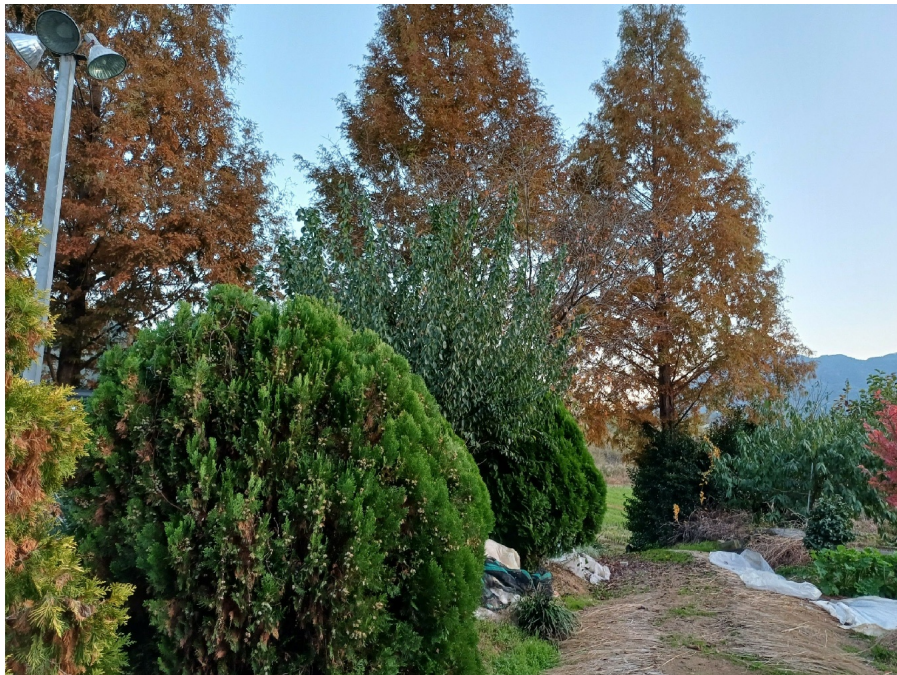
1 ( )