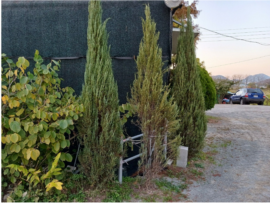
1 ( )