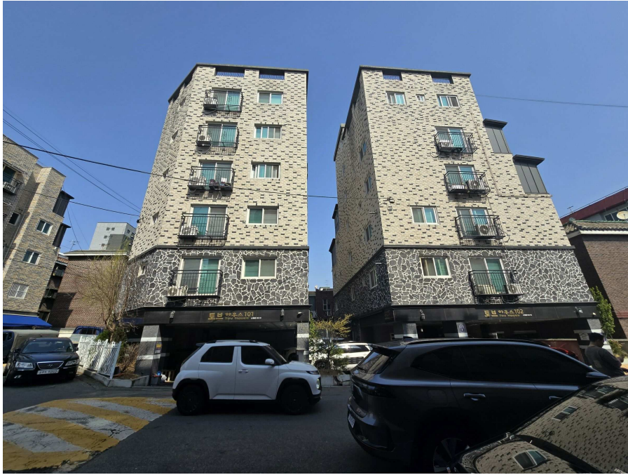
본건 건물 전경1