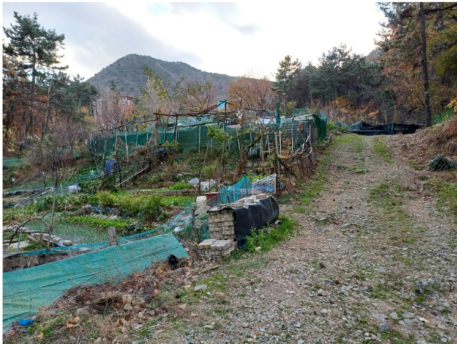
1, 3, 8