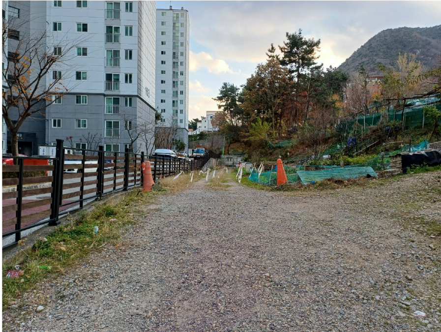
2, 7, 9, 10