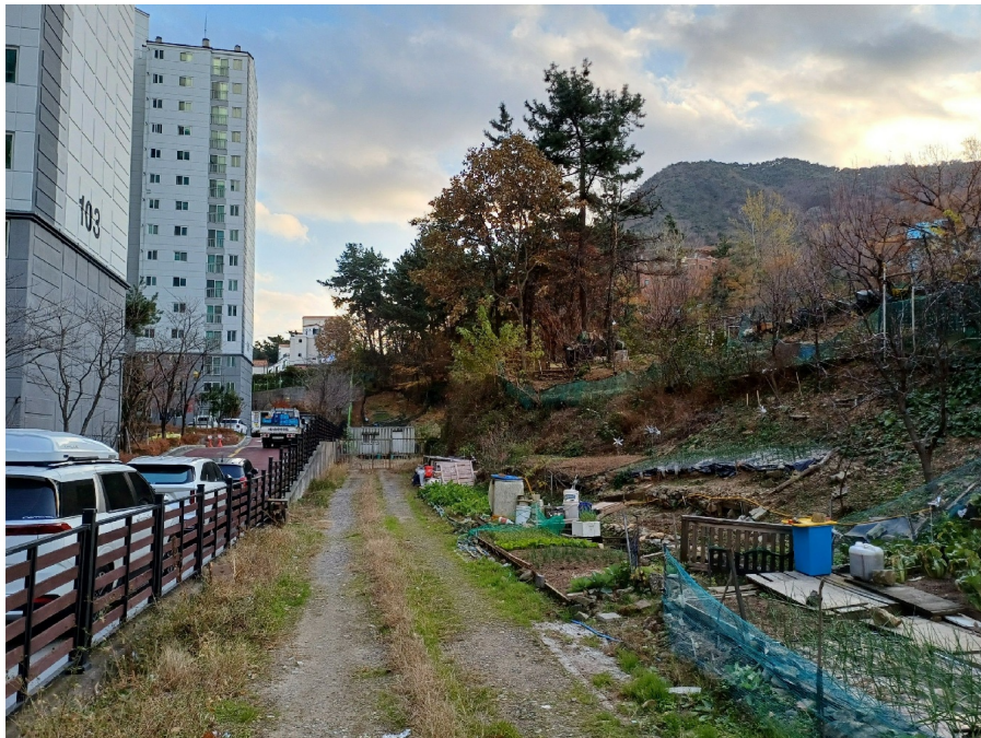
7, 9, 10