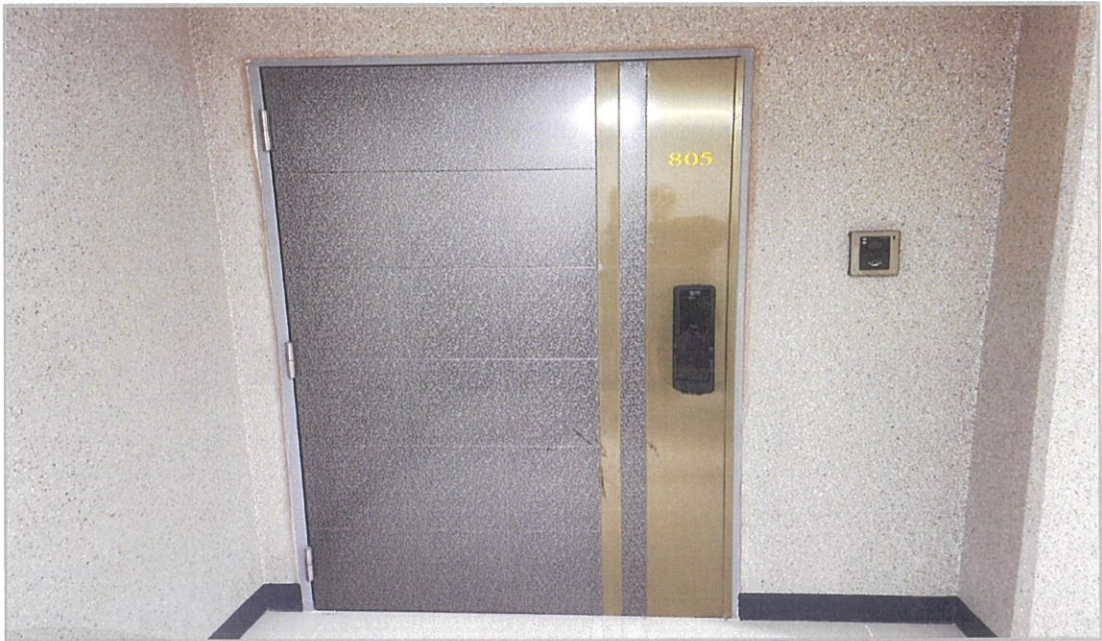
본건 기호 (1) 현관 입구 전경