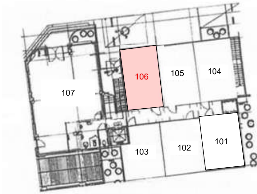
[ 펴스빌 1층 106호 ]