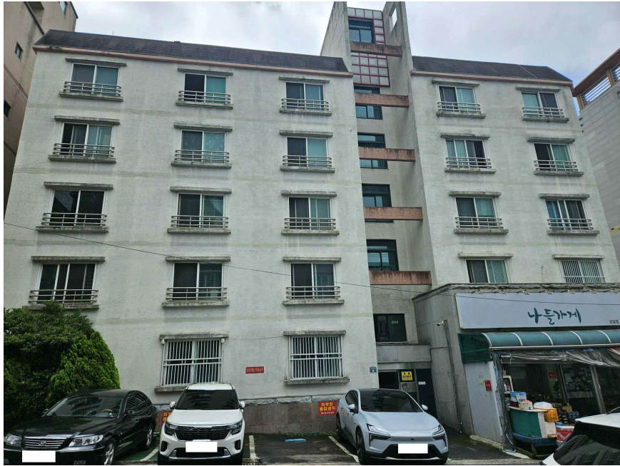
본건 외부 전경