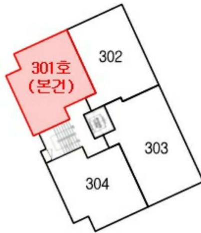
[경민아트빌 제3층 호별배치도]

소재지 서울특별시 강서구 화곡동 368-23외 경민아트빌 제3층 제301호