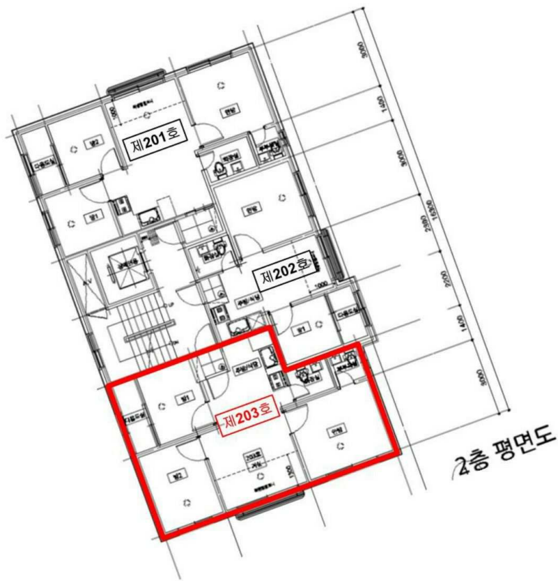
【 호별배치도 및 내부구조도 】

소 재 지 서울특별시 양천구 신월동 523-26 효성쉐르빌 제비동 제2층 제203호