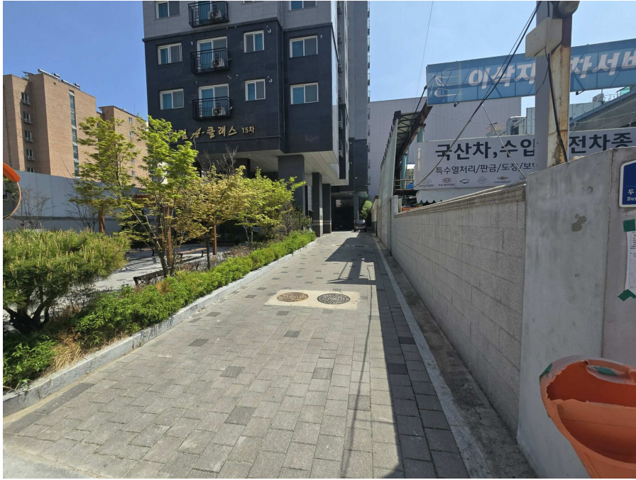
차량 진출입로 및 공개공지