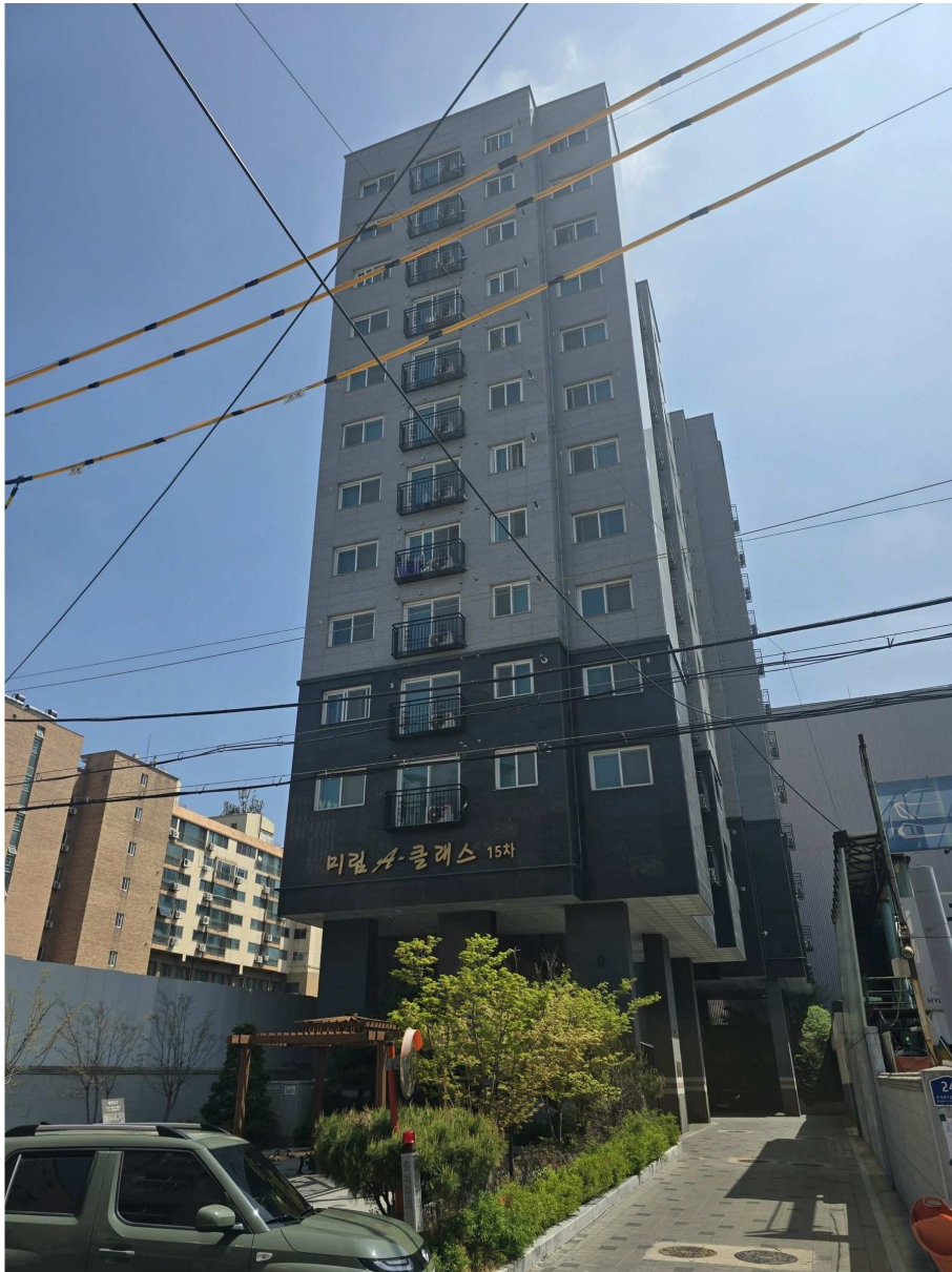
본건 건물 전경