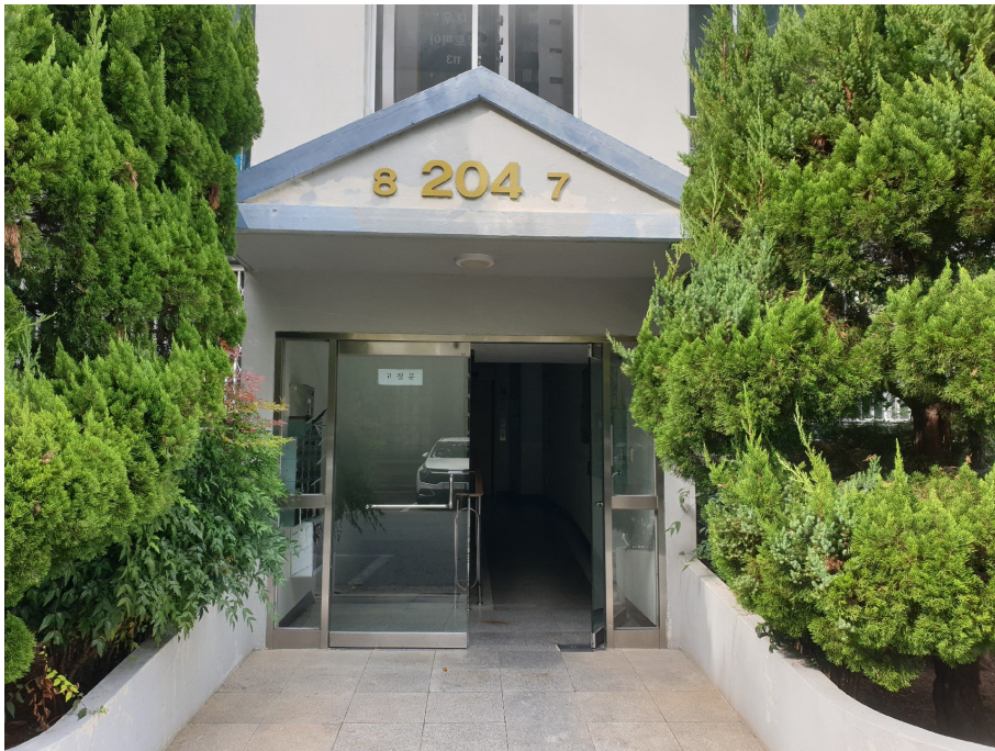
본건 전경(공동현관 출입구)