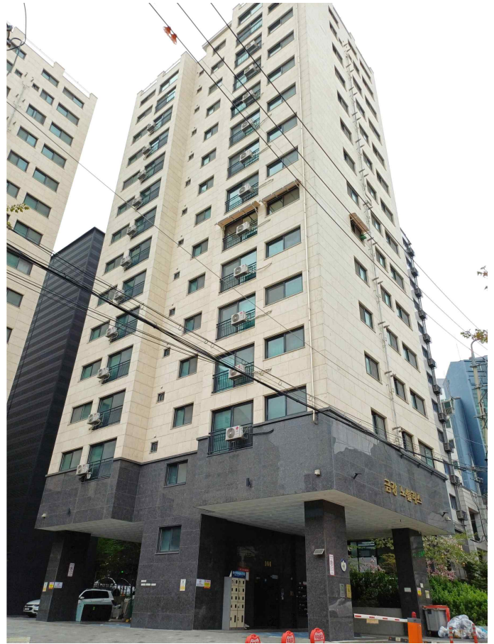
본건 소재 건물 남동측 전경