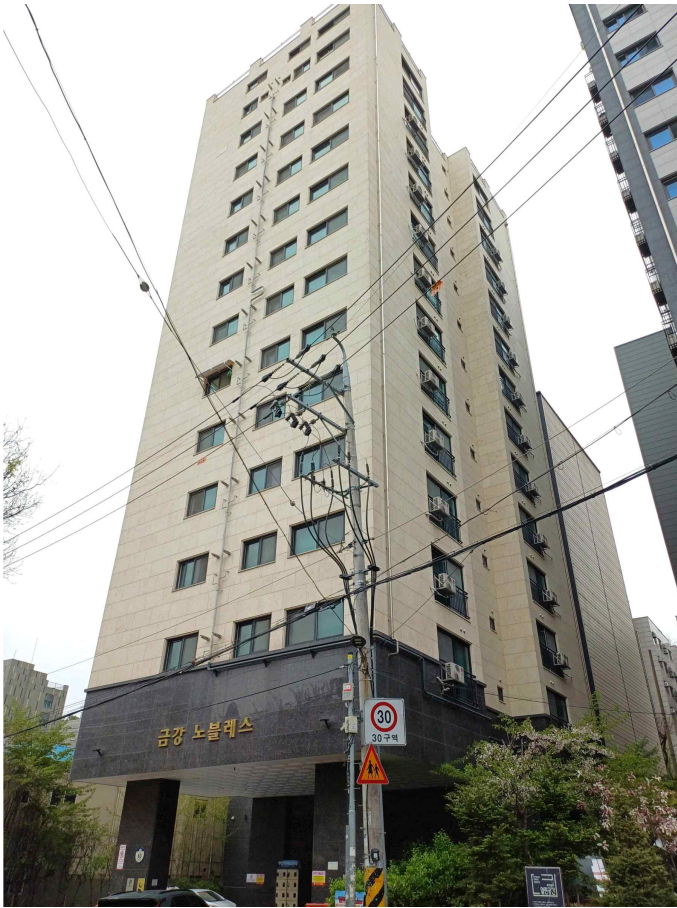
본건 소재 건물 북동측 전경