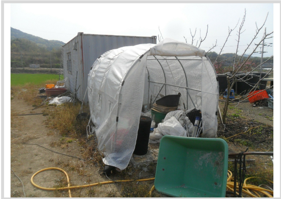
2 , ( )