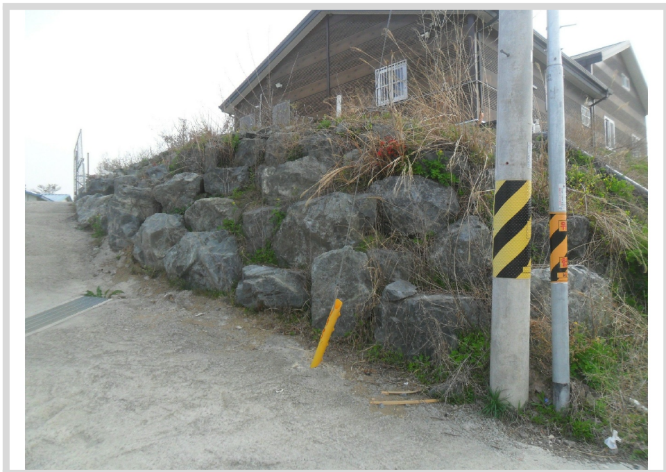
4 ( )