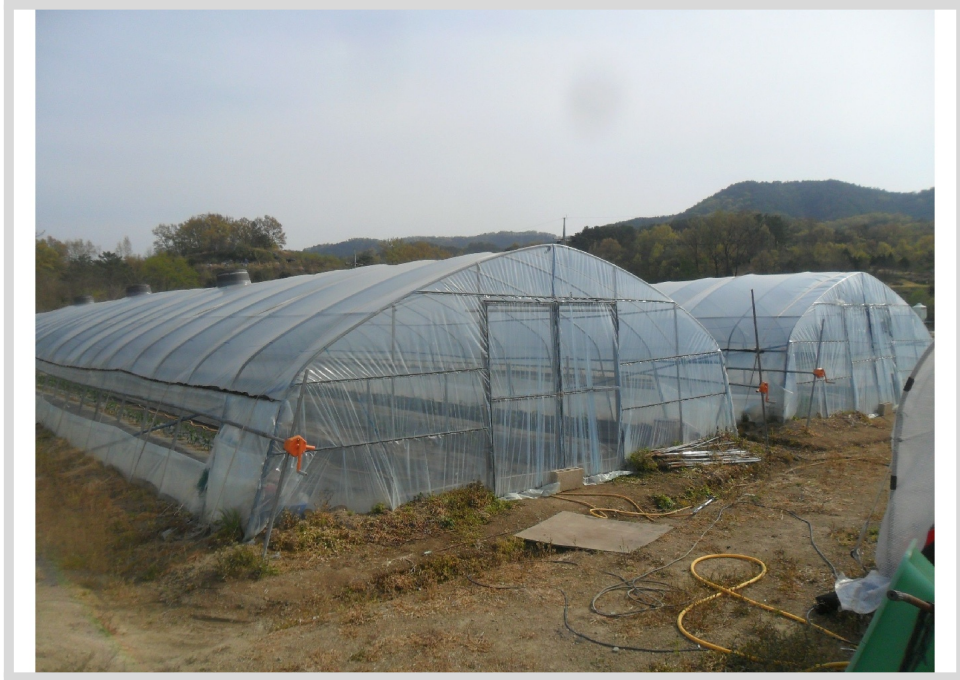
2 ( )