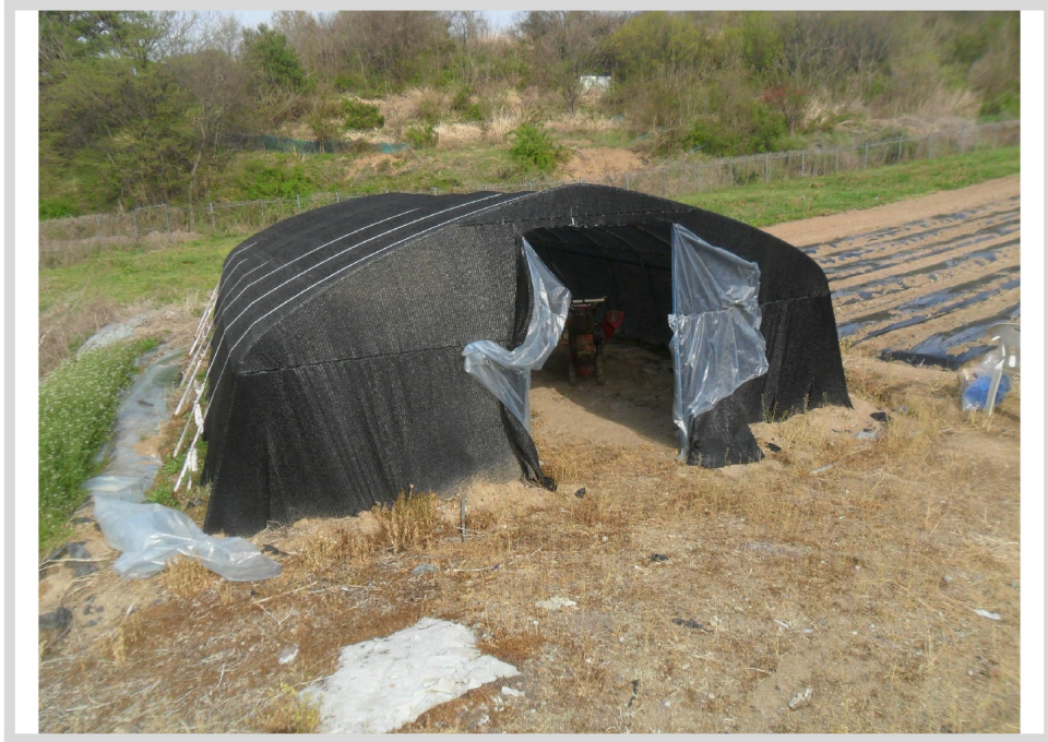
1 ( )