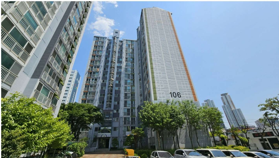
센트럴아파트 106동 전경