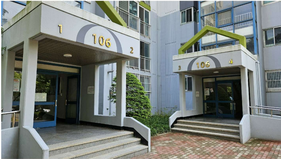
센트럴아파트 106동 1층 출입구