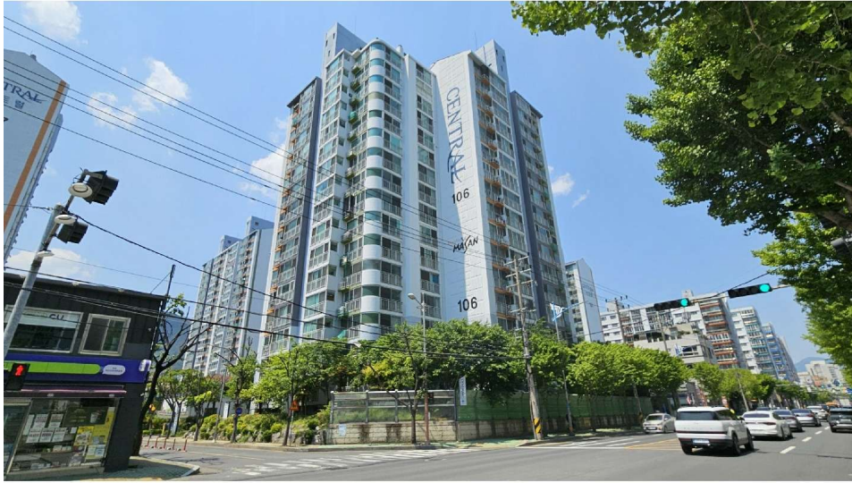
센트럴아파트 106동 전경