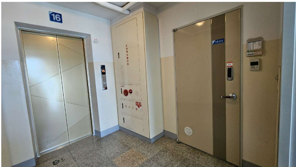
센트럴아파트 106동 1604호