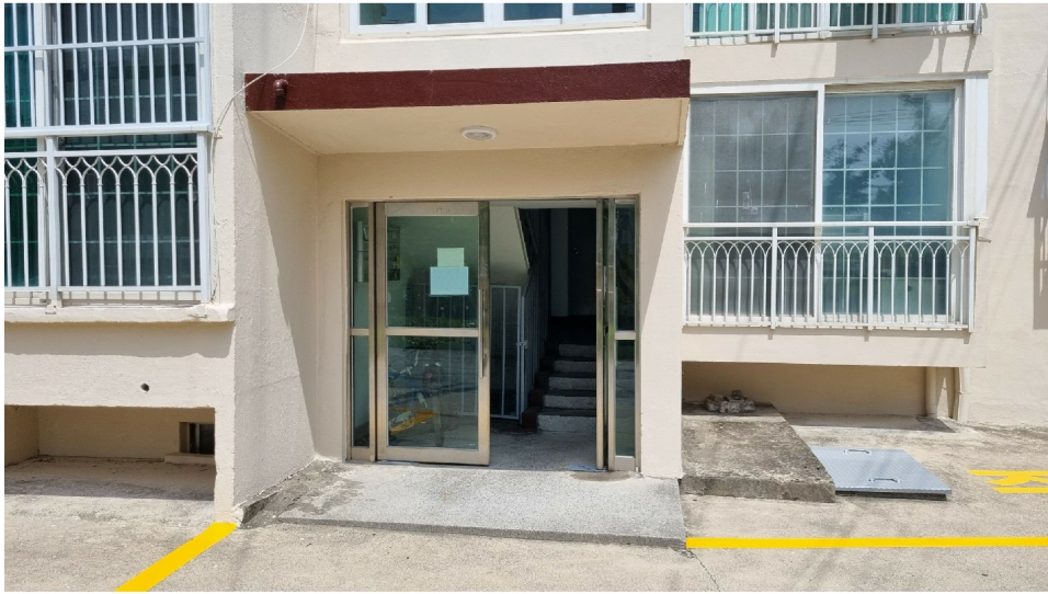
( : ) 7,8