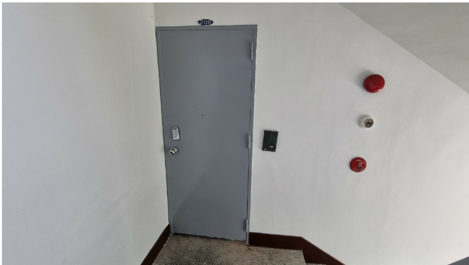
( : ) 2 208