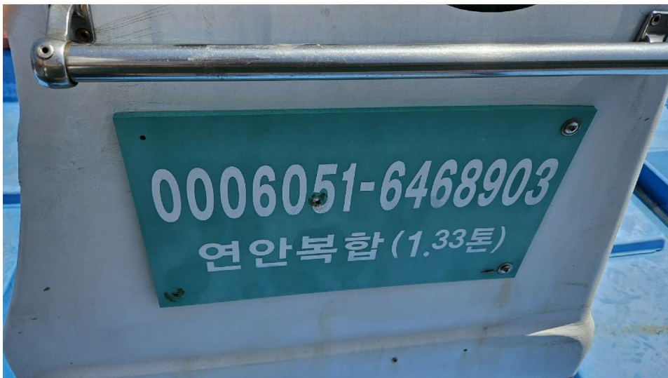
어선번호 및 어업허가내용