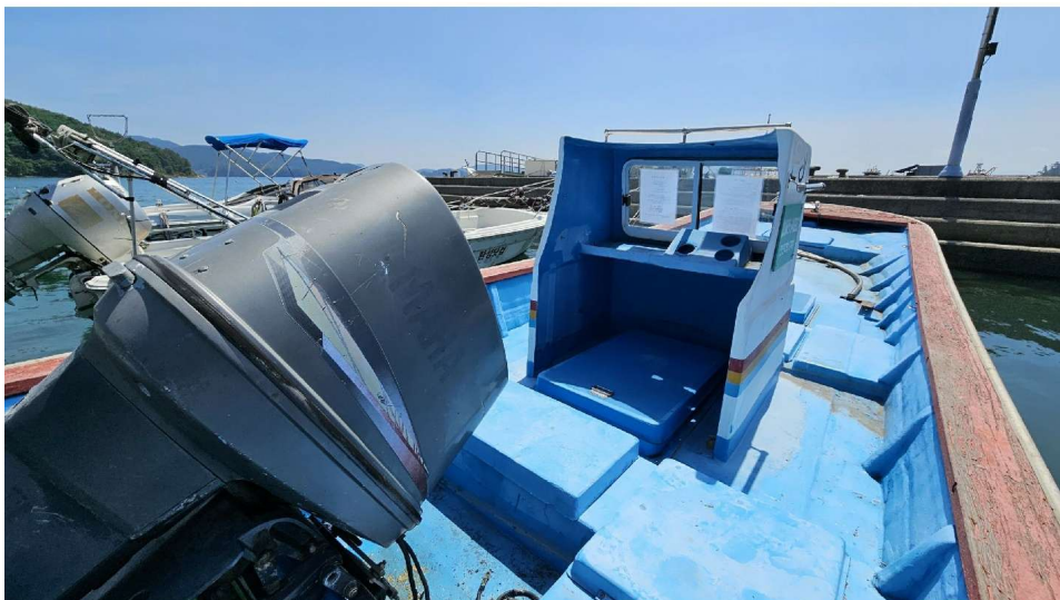
동력선 은성호 (선미→선수)