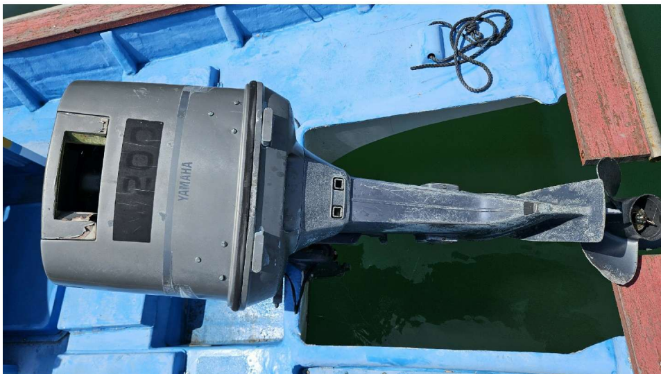
가솔린선외기 기관 200마력 1대