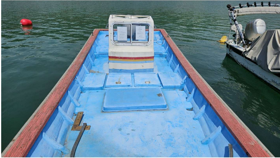
동력선 은성호 (선수→선미)