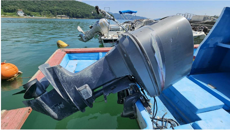
가솔린선외기 기관 200마력 1대