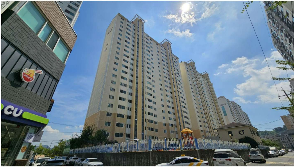
씨티해오름아파트 북서측→남동측 전경