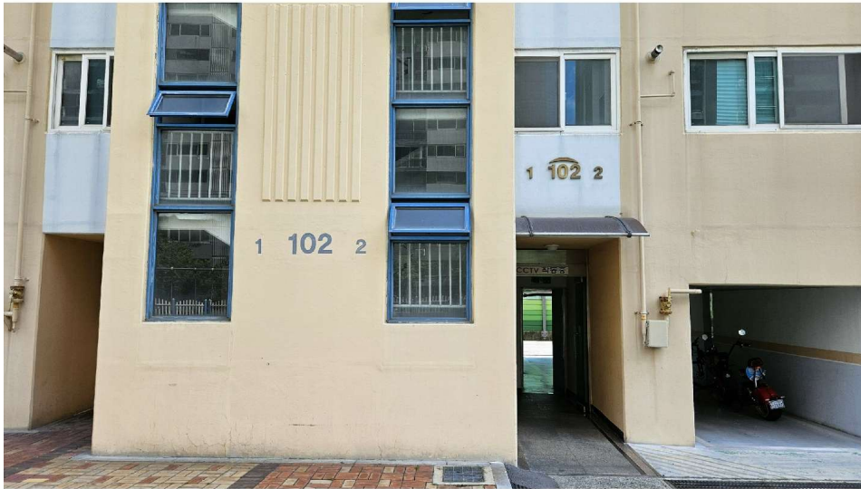
씨티해오름아파트 102동 1·2호라인 1층 출입구