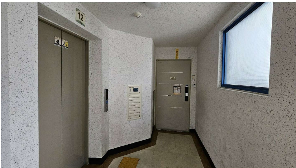
씨티해오름아파트 102동 12층 1202호