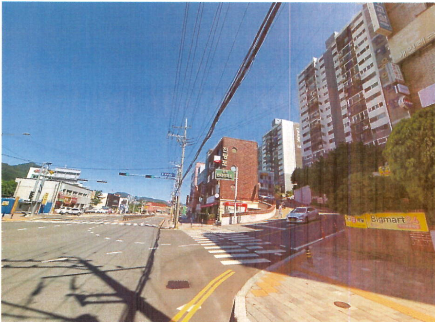
본건 및 주변환경