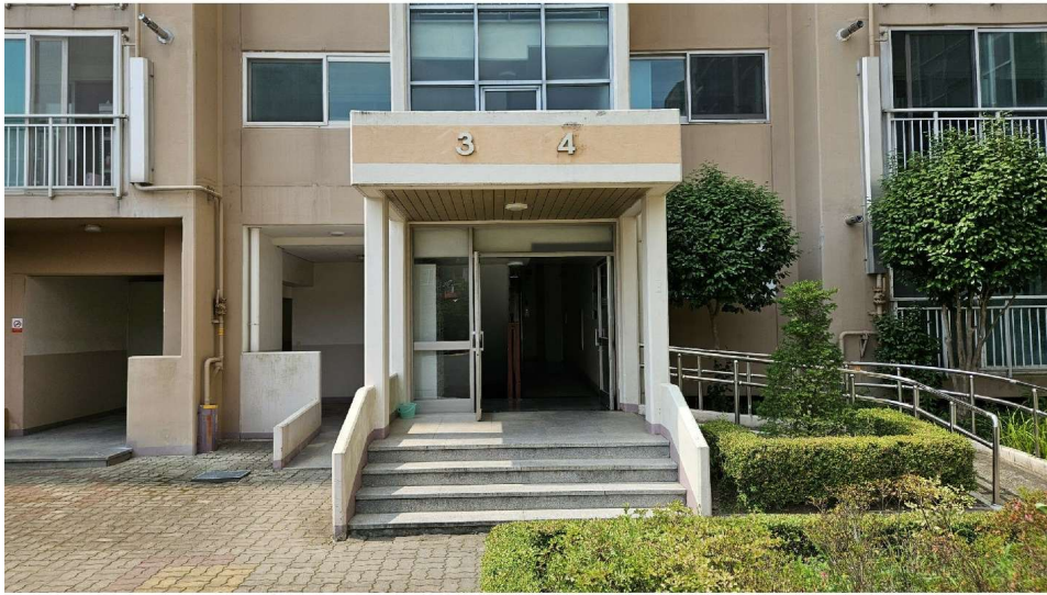
회원주공아파트 101동 3·4호라인 1층 출입구