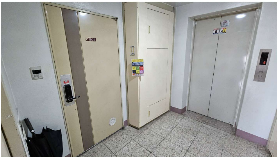
회원주공아파트 101동 5층 503호