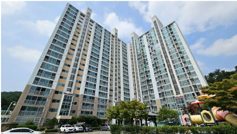
회원주공아파트 101동 전경