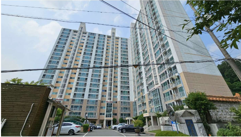
회원주공아파트 101동 전경