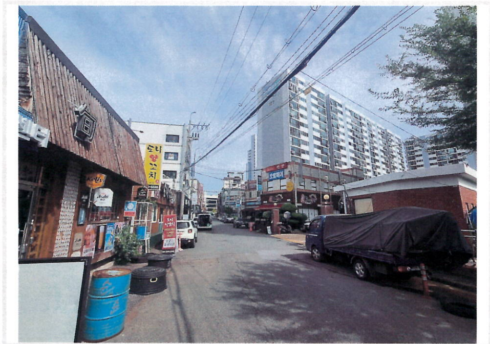
본건 아파트단지 및 주변환경