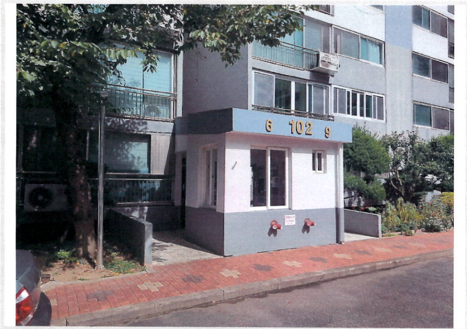
본건 공동 출입문