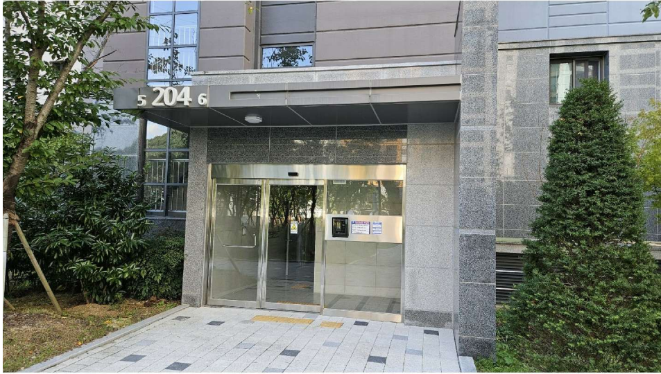
창원 가포 안단테 204동 5·6호 라인 1층 출입구