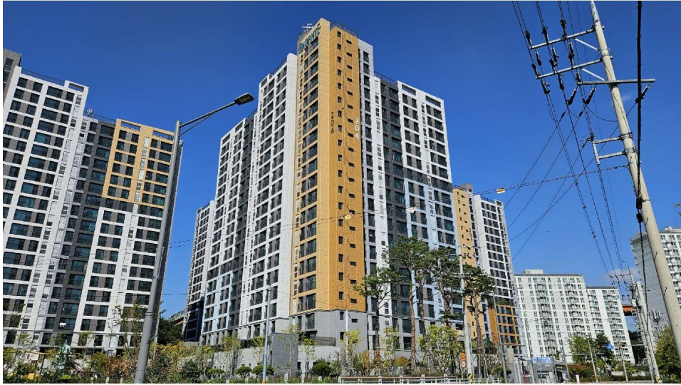
창원 가포 안단테 204동 전경