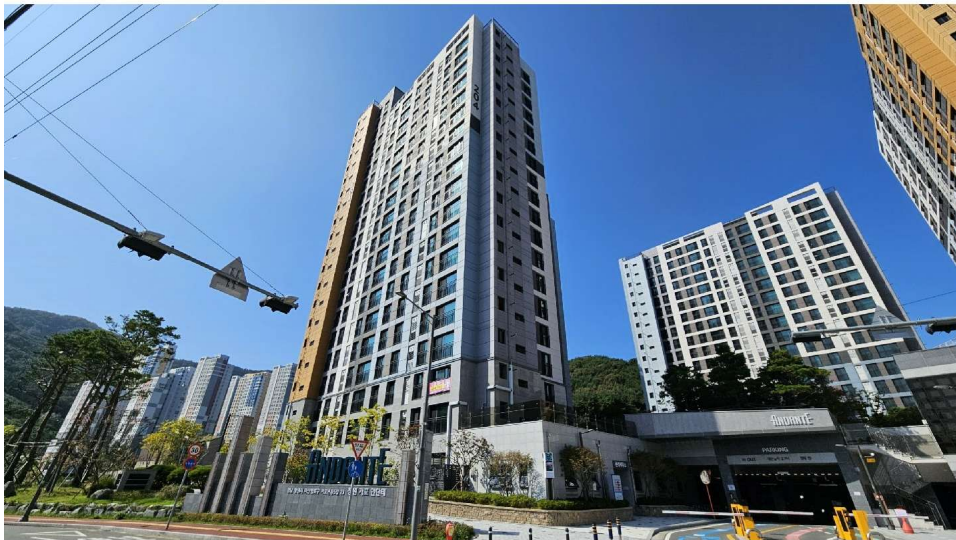
창원 가포 안단테 204동 전경