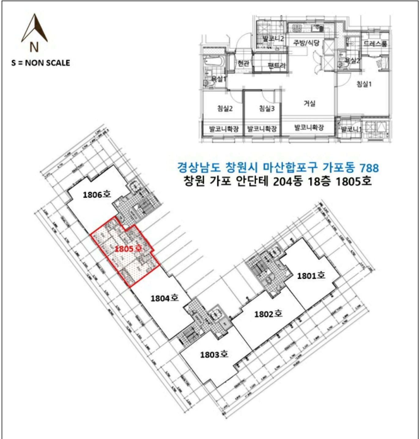
경상남도 창원시 마산합포구 가포동 788 창원 가포 안단테 204동 18층 1805호