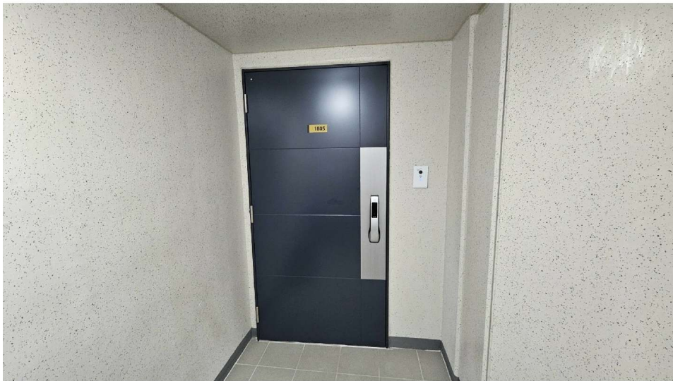
창원 가포 안단테 204동 18층 1805호