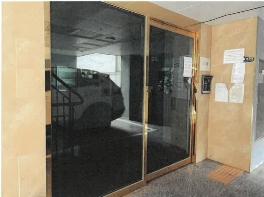
본건 건물 1층 공동출입구