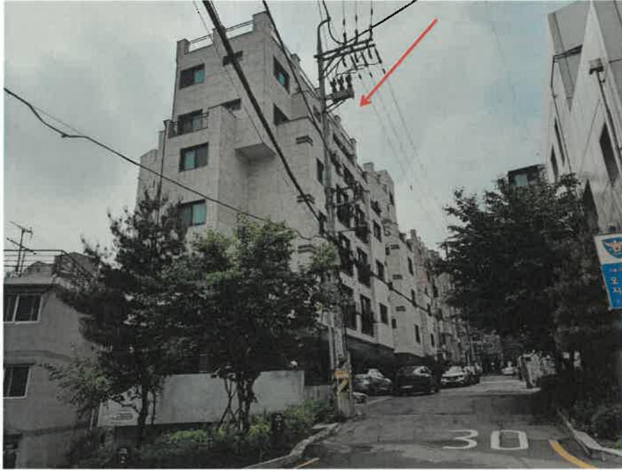
접면도로 및 주위환경(남동측에서 촬영)