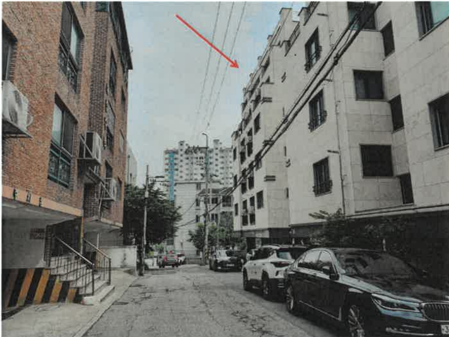
접면도로 및 주위환경(북서측에서 촬영)