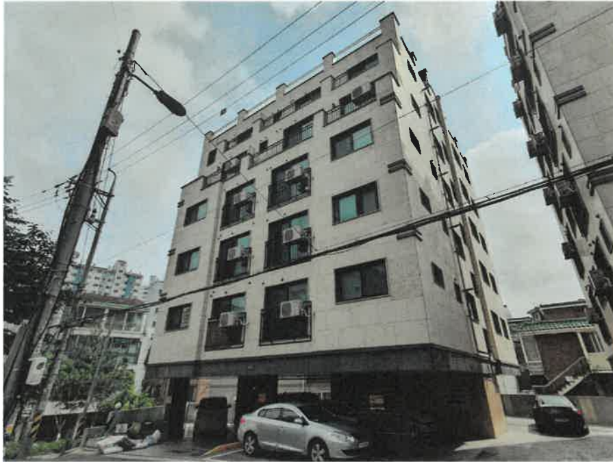
본건 건물 전경