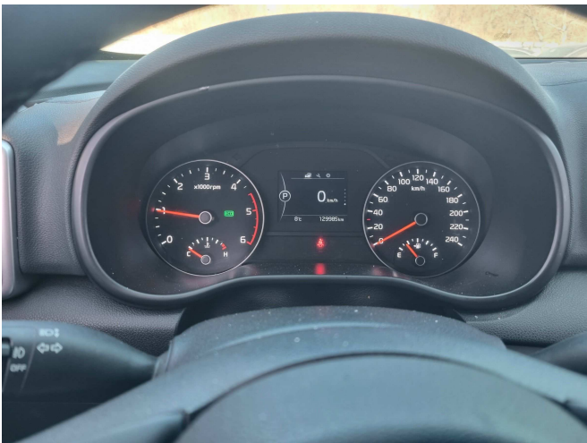
본건 계기판 부분