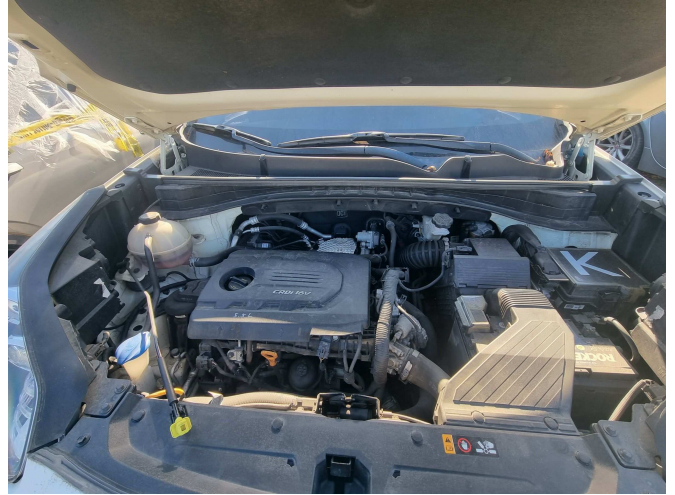
본건 본넷트 내부