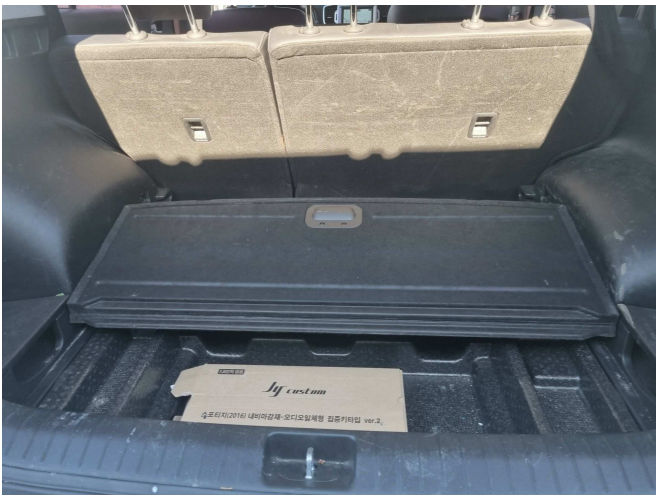
본건 트렁크 내부