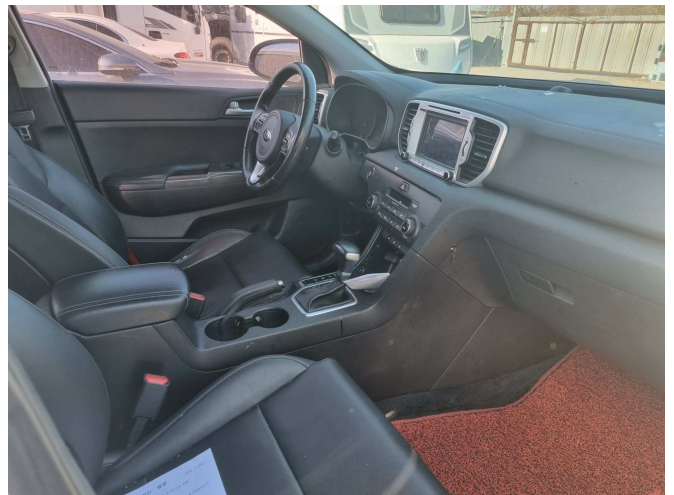
본건 조수석 부분