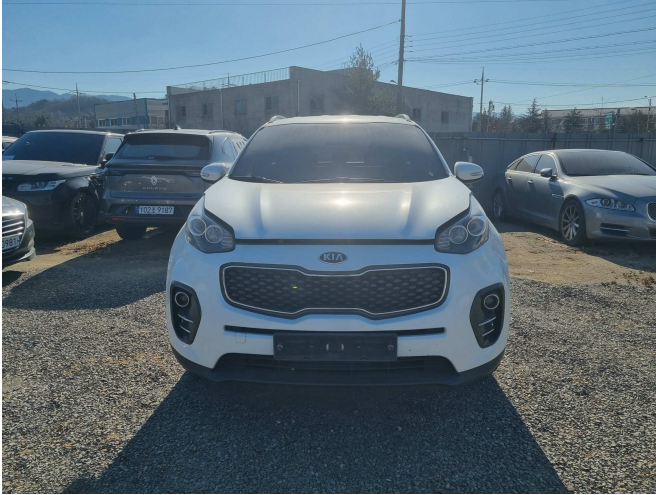
본건 전면 부분