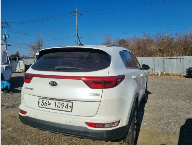
본건 후측면 부분