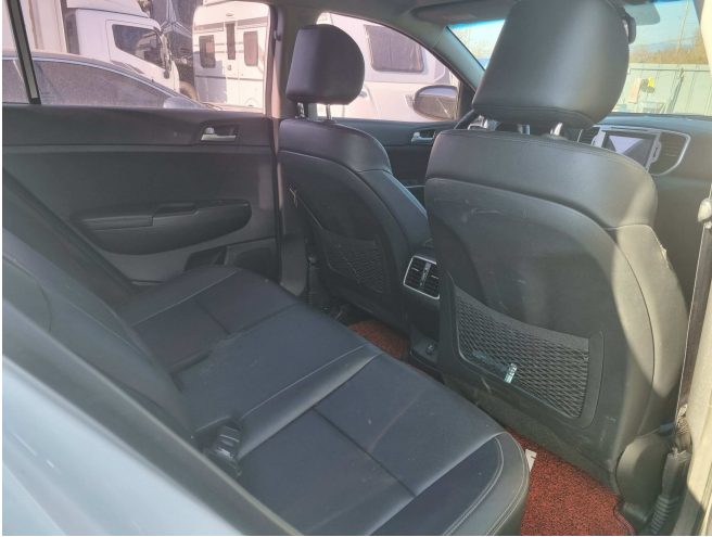
본건 뒷좌석 부분