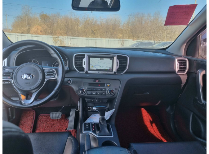
본건 운전석 부분