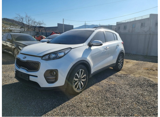
본건 전측면 부분