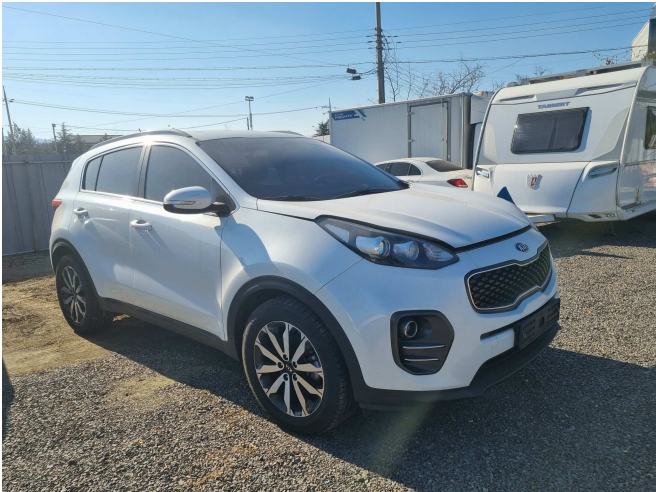
본건 측면 부분