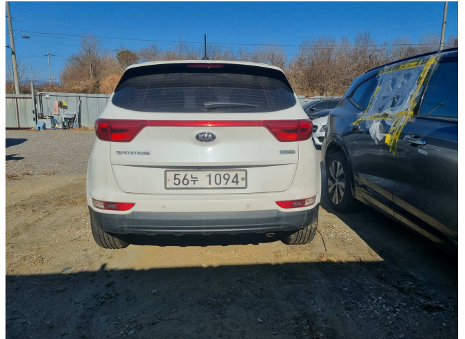
본건 후면 부분